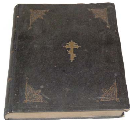
Псалтир (Львів, 1901). З фондів Музею української культури у Свиднику.