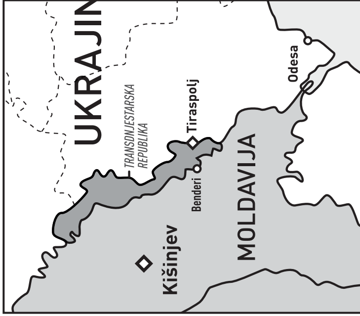
A Samoproglašena separatistička teritorija Pridništrovije (Transdniestarska republika)