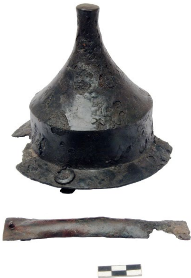
Рис. 6. Умбон та держак з поховання у Волиці.

Форму щитів германських воїнів дослідники 26 реконструюють за зображеннями на римській скульптурі. Мініатюрні копії щитів були знайдені в жіночих та дитячих похованнях пшеворської культури 27 . Так, у похованні в Надколе (Мазовія) виявлено виготовлену із залізної бляхи товщиною 1 мм модель видовженого шестикутного щита, розмірами 71 x 41 мм. У центрі платівки видавлена конічна опуклість, що імітує умбон, на звороті є імітація держака (рис. 7). На території Польщі та в інших регіонах Європи відомі нечисленні мініатюрні копії щитів інших форм 28 .