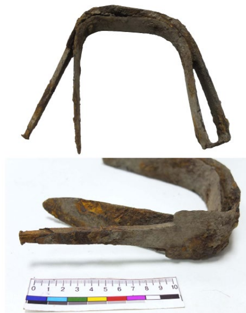
Рис. 4. Меч з поховання у Волиці.