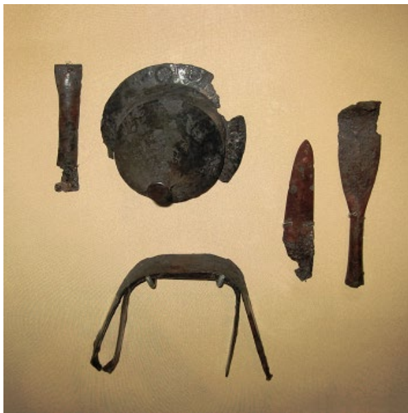
Рис. 1. Комплекс озброєння з поховання пшеворської культури у Волиці у експозиції НМІУ.

Отже, перейдемо до опису знахідок. Обидва наконечники списів були спеціально поламані. Перший із них – ромбічний у перерізі, масивний видовжений листопадібний наконечник (довжина – 210 мм, максимальна ширина – 44 мм) (рис. 2) має загнутий край вістря. Наконечник плавно переходить у масивну втулку із розширеним кінцем (довжина – 80 мм, діаметр – 16–22 мм). На відстані 10 мм від її кінця зберігся цвях, яким втулка прикріплювалася до дерев'яного древка. За класифікацією списів пшеворської культури П. Качанівського, волицький наконечник належить до типу XIII, поширеного у фазах В2 / С1 (150–270 рр. н. е.) 5 .