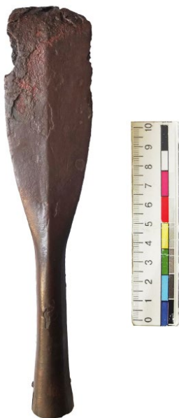
Рис. 2. Наконечник списа з поховання у Волиці.

Отже, перейдемо до опису знахідок. Обидва наконечники списів були спеціально поламані. Перший із них – ромбічний у перерізі, масивний видовжений листопадібний наконечник (довжина – 210 мм, максимальна ширина – 44 мм) (рис. 2) має загнутий край вістря. Наконечник плавно переходить у масивну втулку із розширеним кінцем (довжина – 80 мм, діаметр – 16–22 мм). На відстані 10 мм від її кінця зберігся цвях, яким втулка прикріплювалася до дерев'яного древка. За класифікацією списів пшеворської культури П. Качанівського, волицький наконечник належить до типу XIII, поширеного у фазах В2 / С1 (150–270 рр. н. е.) 5 .