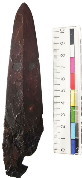
Рис. 3. Наконечник списа з поховання у Волиці.