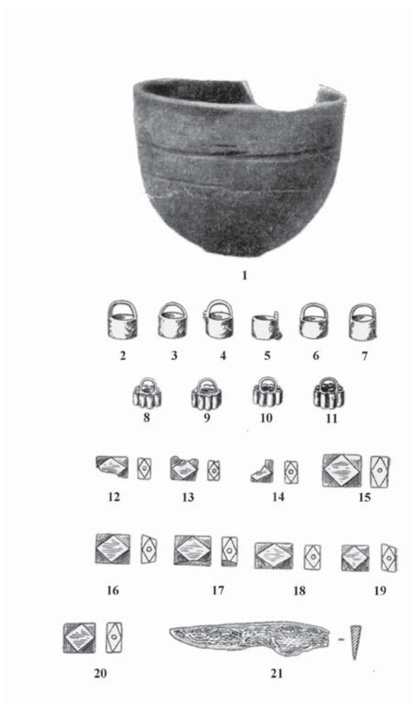
Рисунок 4. Інвентар з поховання № 19. 1 – келих; 2–7 – залізні підвіски-відерця; 8–11 – залізні підвіски-розетки; 12–20 – сердолікові кубооктоедричні намистини; 21 – залізний ніж (за Кухаренком, 1955).

європейського населення з рубежу II–III ст., на кінець III ст. вже вичерпала себе. У IV ст. європейське населення надає перевагу скляному намисту такої ж форми, яке коштувало дешевше, оскільки його виробництво було значно простішим 20 .