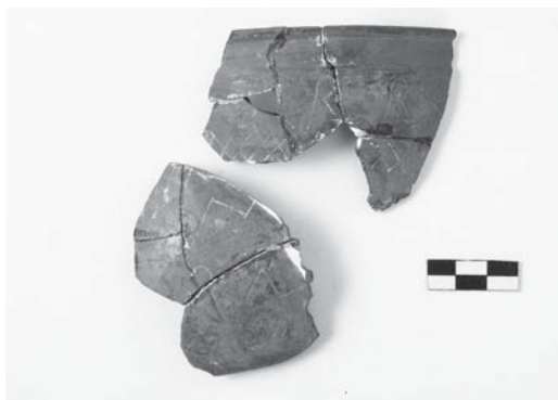
Рисунок 1. Уламки келиха-чаші з поховання № 12 могильника Привільне.

У 1950-ті рр. матеріали розкопок були опрацьовані та опубліковані Ю. Кухаренком. Проте вже на той час частина речей була втрачена. Так при описі інвентарю поховань майже в кожному випадку зазначені предмети, що не збереглися 3 .