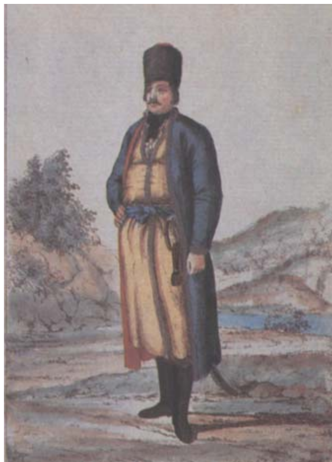
Художник Г. Гейслер. Офіцер казачого війська 1780–початку 1790-х рр. Розмальована гравюра

губернські структури. І таких проблем перед новоствореним військом поставало багато. Серед них – втеча козаків, занепад господарств, зловживання офіцерів владою, крадіжки, затримання виплати грошей за службу. Часто козаки вмирили від голоду, виснаження та хвороб 20 .