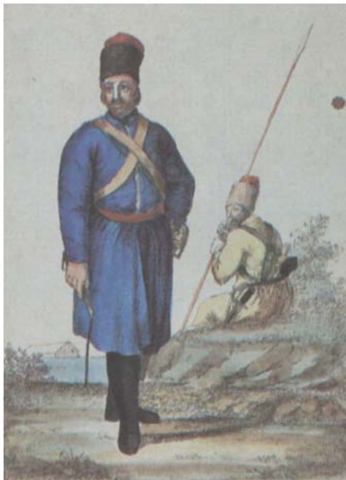
Художник Г. Гейслер. Донський козак 1780 – початку 1790-х рр. Розмальована гравюра