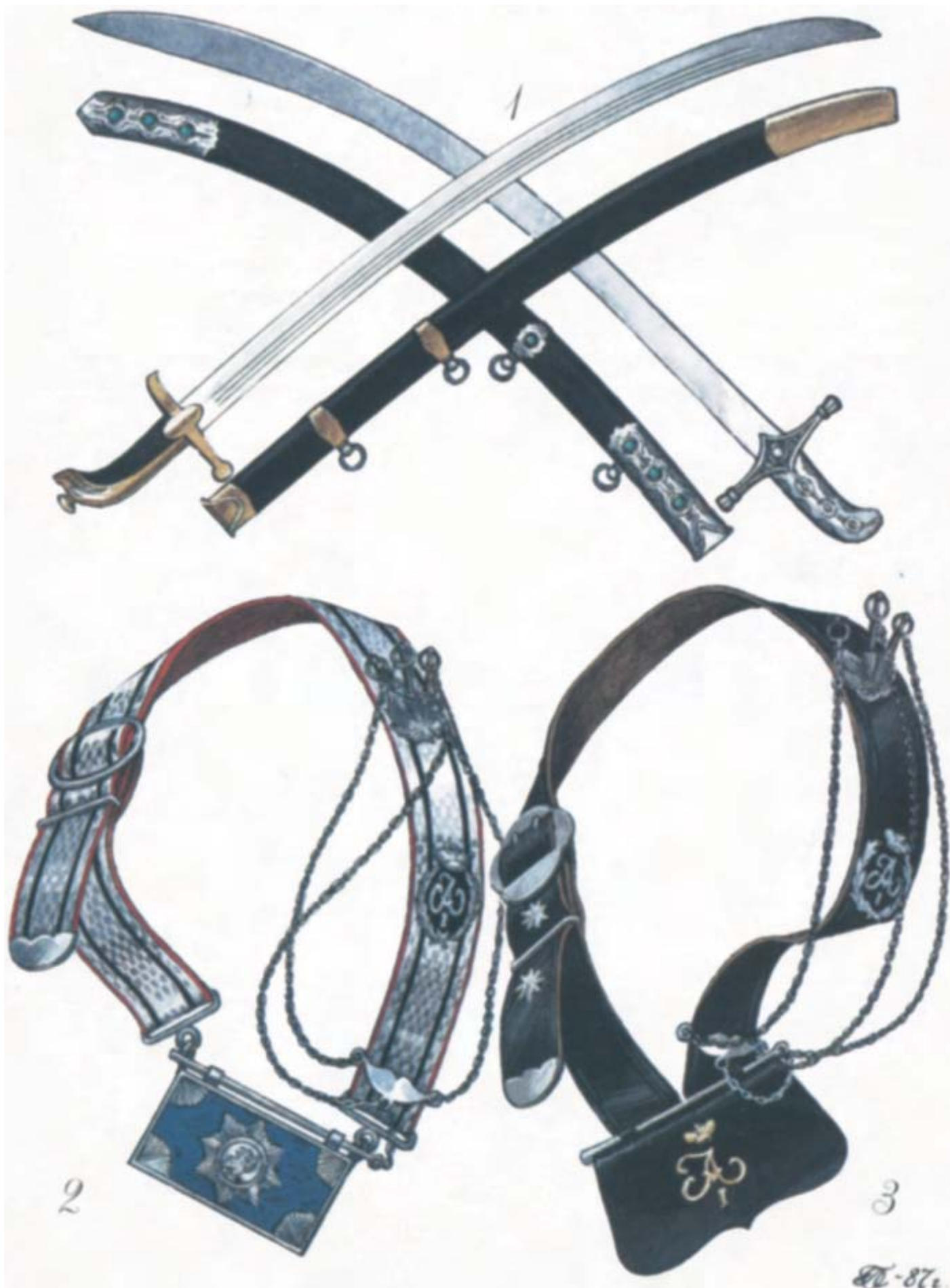
Шаблі і лядунки козачих полків. 1812 р.