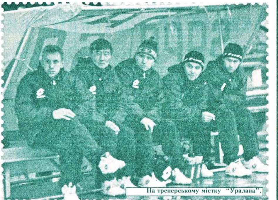
На тренерському містку "Уралана".