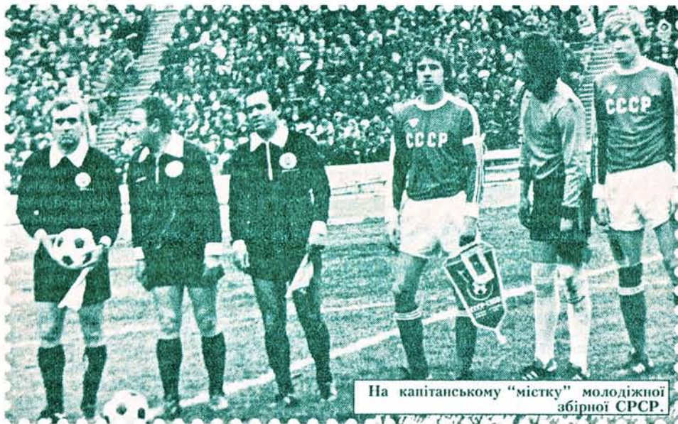
На капітанському "містку" молодіжної збірної СРСР.