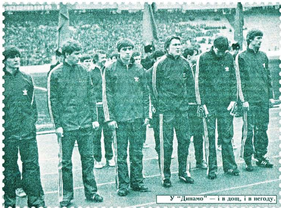
У "Динамо" — і в дощ, і в негоду.

методика тренувань, які дещо заспокоїли мене та мій фізичний стан. Трохи розслабився, і як наслідок — зазнав серйозної травми і вивбував на довгий час зі строю. Тим часом мій контракт із "Маккабі" завершувався, а від пошкодження я ще не встиг оговтатись. Тому й залишилося підшукувати собі нове місце "під сонцем".