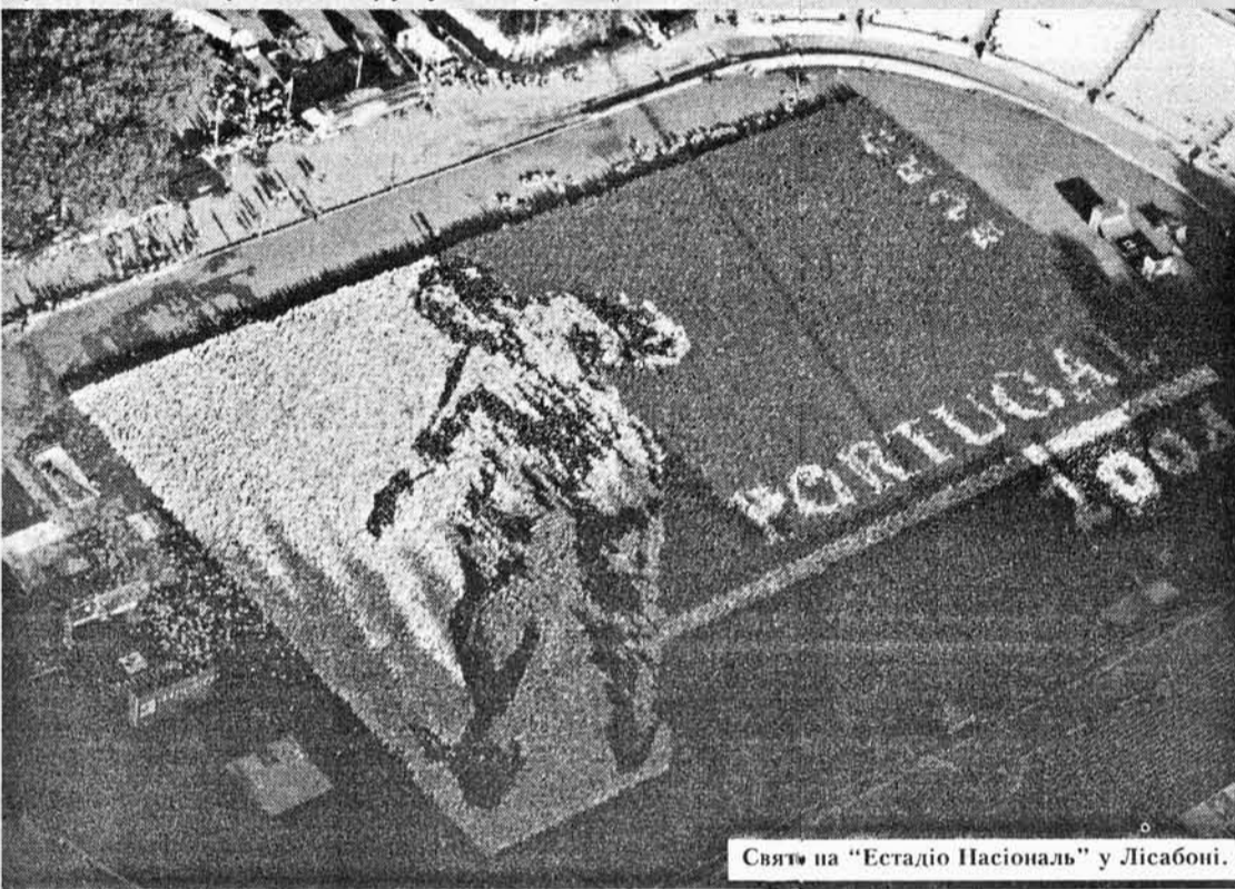
Святу на "Естадіо Насіональ" у Лісабоні.

Піренейці постали піонерами в подібних ситуаціях. "Пробивати коридор" на шляху до європейського фестивалю вони вирішили своєрідним способом, влаштувавши презентації в різних куточках материка, що мають за мету популяризацію країни, фінансово та організаційно спроможної зрушувати гори.