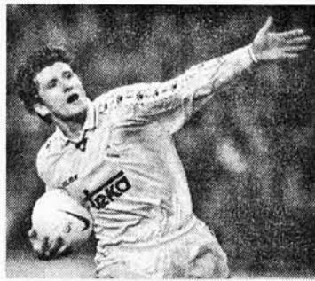
— Даворе, — звертаємося до Шукера, — як вдалося так швидко адаптуватися в команді? Забиваєш вправно. З неслабкою "Астон Віллоу" відзначився дуплетом.

— Партнери імениті — гріх скаржитися. Упевнений, регулярно "розписуватимуть" у воротах суперників і надалі. Аби тільки випускали в "основі".