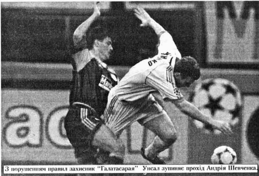
З порушенням правил захисник "Галатасарая" Унсал зупиняє прохід Андрія Шевченка.