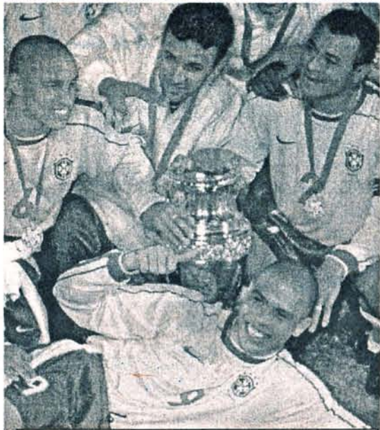
Роберто Карлос, Сезар Августо, Кафу (зліва на право) та Роналдо з кубком Південної Америки.

Оглядачі більше уваги звертають не на рахунок цього матчу, а на саму гру переможців. Так, журналісти зазначають, що значно додали Рівалдо та Роналдо. На почат-