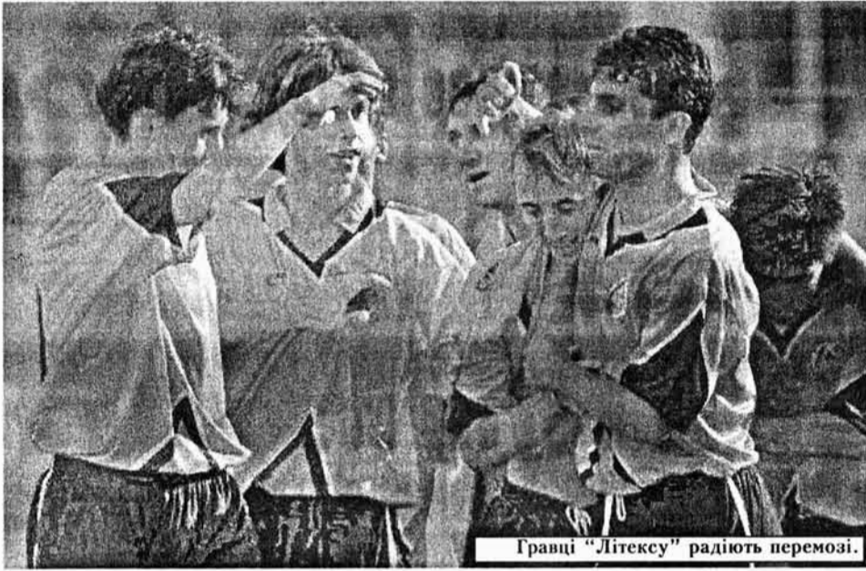
Гравці “Літексу” радіють перемозі.