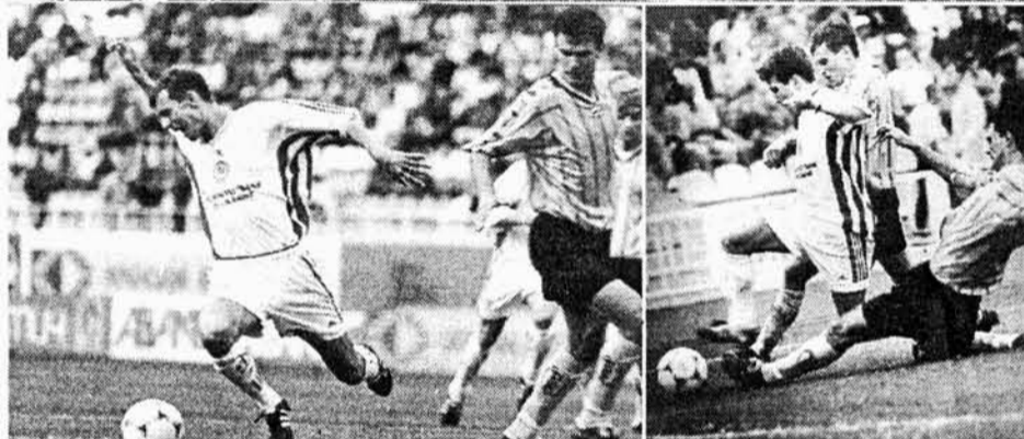
Так перемогли кияни. 16 липня. Стадіон “Динамо”.

Запитання, на які мав дати відповідь цей матч, стосувалися, головним чином, киян. “Металіст” почав першість незмінним складом, отже, його можливості всім зрозумілі. Натомість “Динамо”, втративши двох провідних гравців, невдало провело поєдинок із “Кривбасом”. Звітна зустріч дала змогу з’ясувати, наскільки ослабла (і чи ослабла взагалі) команда Лобановського.