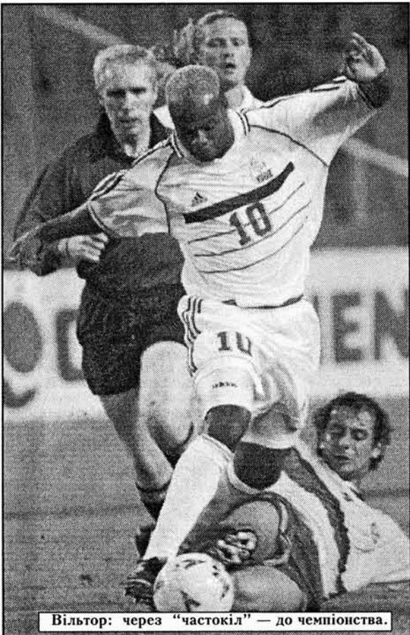
Вільтор: через "частокіл" — до чемпіонства.