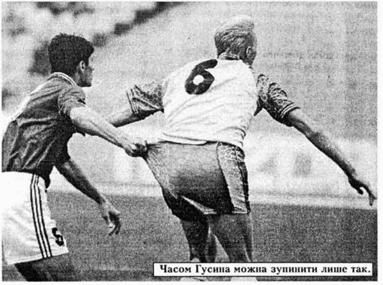
Часом Гусина можна зупинити лише так.

— Все досить просто: перемагає сильніший, наполегливіший, фартівіший. Ми мали у своєму розпорядженні ці якості. А ще нам дуже поталанило: мати лише три нагоди забити м'ячі і всі їх реалізувати, в той час як суперник таких можли-