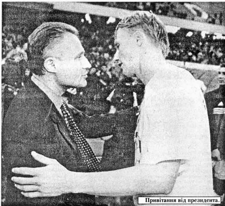
Привітання від президента.