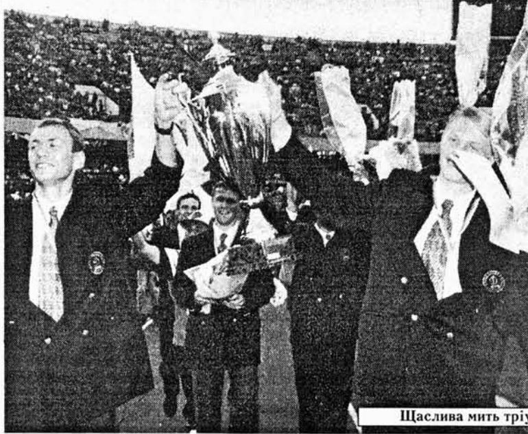
Щаслива мить тріумфу.

— Я взагалі не хотів би коментувати таке. Помилки воротарів на трибунах здаються очевиднішими, "прозорішими", а інколи й фаталь-