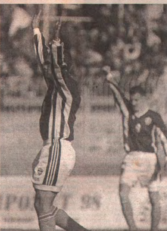
Югославець Альберт Надь (ліворуч) святкує свій другий гол у ворота збірної Мальти.

Мальта — Югославія — 0:3 (0:1). 3000 глядачів. Мальта: Баррі, Саїд, Турнер, Спітері, Камілеррі (Сіксміт), Буттігер, Бузутіл, Саліба, Каработт, Ньюко (Кутаяр), Агіус (Бенчіні). Югославія: Краль, Миркович, Джорвич, Іоаннович, Джукич, І. Станкович (Томич), Надь, Милосевич, Ковачевич (Милошевич), Д. Станкович (Гроздич), Михайлович. Голи: Надь (22, 55), Милошевич (90).