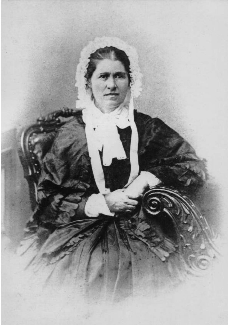
2. Єлизавета Іванівна Драгоманова. Київ, кінець 1870-х рр.