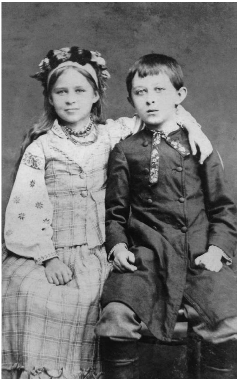
1. Лариса та Михайло Косачі. 1881 р.