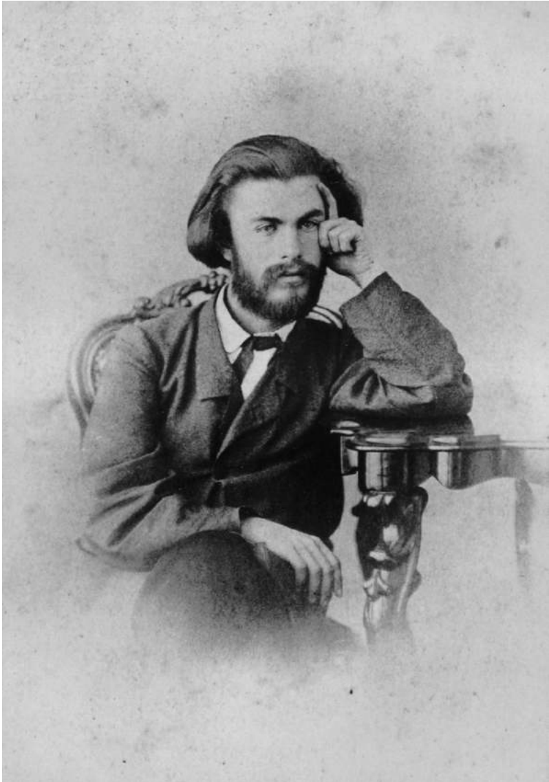
4. Михайло Петрович Драгоманов. Київ, початок 1870-х рр.