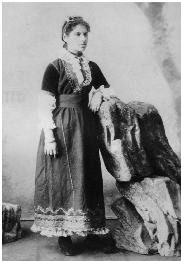
7. Аріадна Михайлівна Драгоманова. Софія, 1894 р.