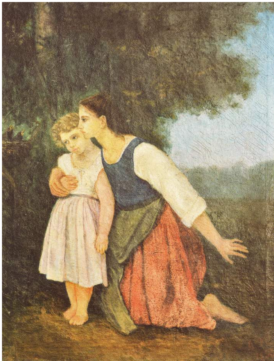
9. Лариса Косач. «Мати з дитиною біля пташиного гнізда». Олія на полотні, 1893 р.