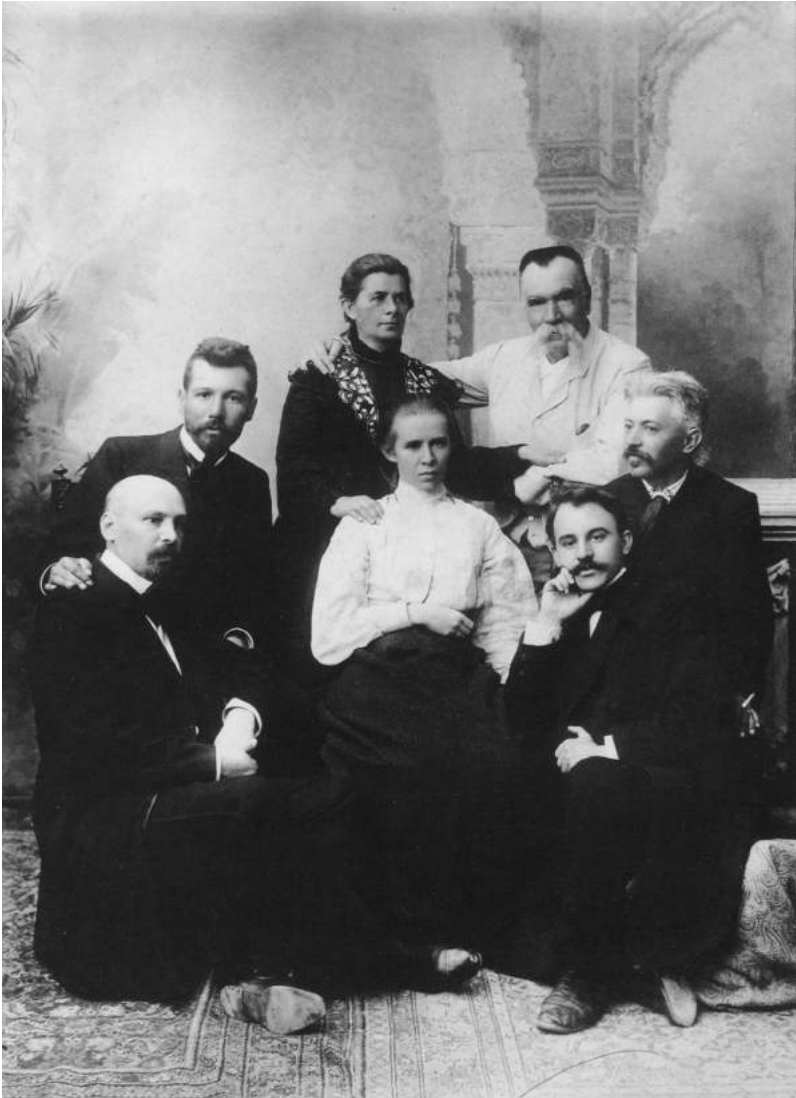
9. Учасники відкриття пам'ятника І. П. Котляревському. Зліва направо, попереду: М. Коцюбинський, Леся Українка, Г. Хоткевич; позаду: В. Стефаник, Олена Пчілка, М. Старицький, В. Самійленко. Полтава, 1903 р.