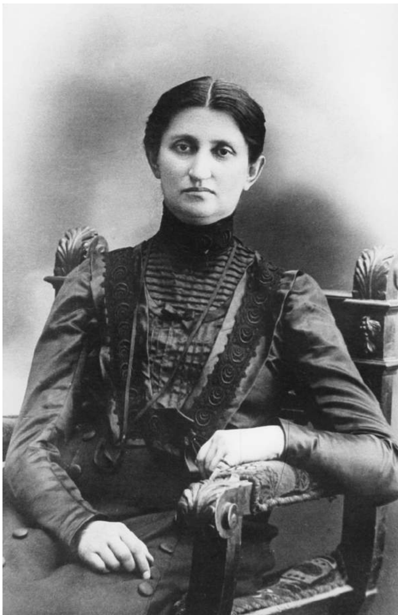
5. Ольга Кобилянська. Чернівці, 1911 р.