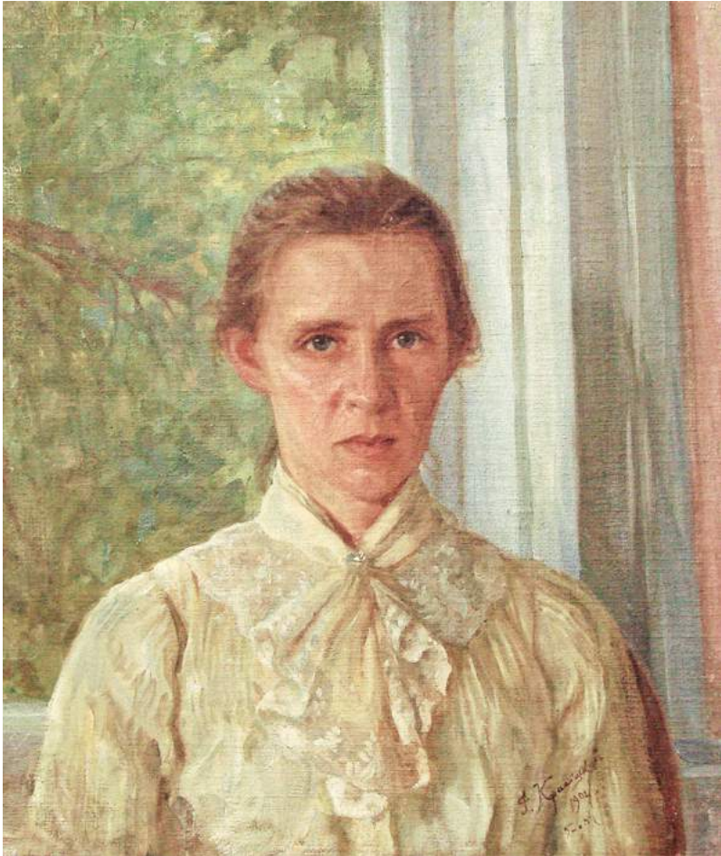
1. Леся Українка. Портрет роботи Фотія Красицького. 1904 р.