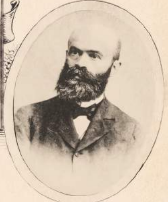
Михайло Павлик. * 1853