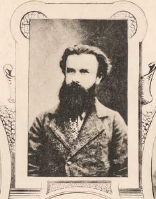
Михайло Драгоманів. * 1841 † 1895