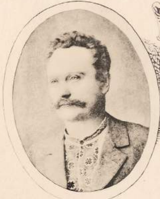
Др. Іван Франко. * 1856