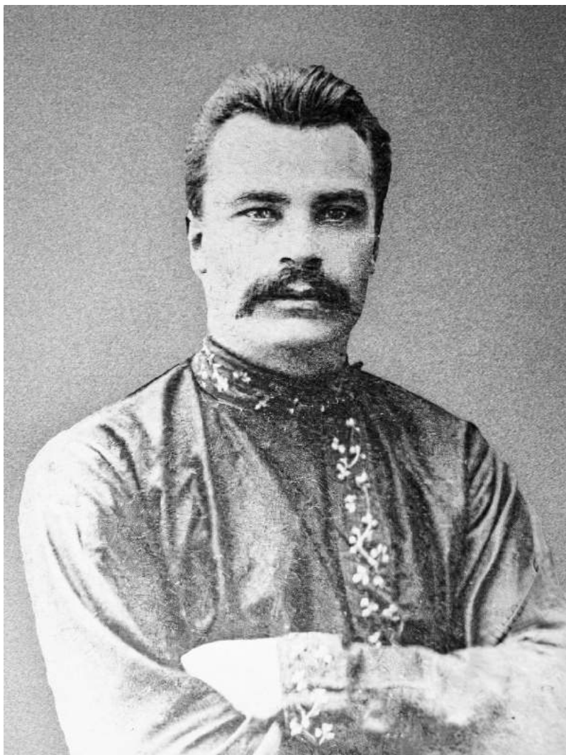
6. Володимир Винниченко, фото 1910-х рр.