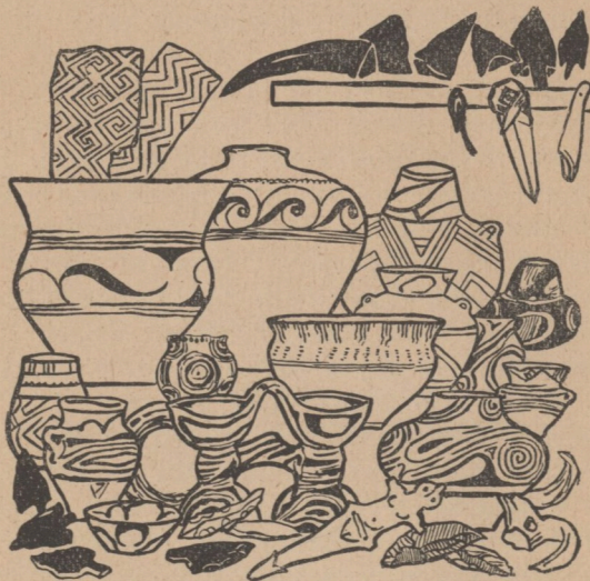
Знаряддя камінної доби з терену України.

мали ніякої, або обпиналися листями та шкурами звірячими 1) . Шили одержу тую риб'ячими кістками або камінними шилами. Де далі почали вже люде виробляти собі різні