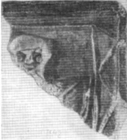
Рис. 2. Рельєфна полив'яна поліхромна кахля (фрагмент). Староконстантинів. Перша половина — середина XVI ст.

Питання про походження старицько-дмитровських рельєфів дослідники намагалися вирішити кількома шляхами. Одним з них був мистецький аналіз творів та окремих елементів, коли старанно досліджували іконографічні особливості, проводили аналогії. В результаті було зроблено певні наукові висновки 7 . Зображення Георгія з південної стіни