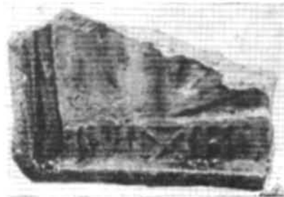
Рис. 5. Рельєфна полив'яна поліхромна кахля (фрагмент). Старокостянтинів. Перша половина — середина XVI ст.

го розвитку давньоруської спадщини, ніж, наприклад, у Придніпров'ї, яке зазнало особливо жорстокого розгрому. Слід зважити й на те, що в південноруських землях полив'яна кераміка стала таким же традиційним різновидом художнього ремесла, як, скажімо різьблення по дереву й кості у Новгороді.