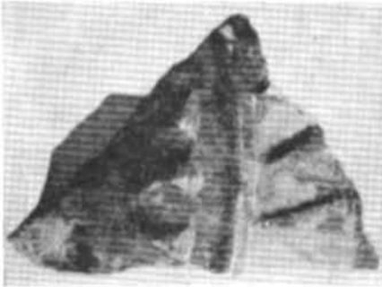
Рис. 4. Кругла рельєфна полив'яна архітектурна вставка (фрагмент). Старокостянтинів. Перша половина — середина XVI ст.

Доля давньоруської спадщини після татарської навали в різних руських землях складалася неоднаково. Волинь зазнала найменшого руйнування. Сюди звідусіль збиралися втікачі, серед яких були й досвідчені майстри. Тому тут створилися дещо кращі умови для дальшо-