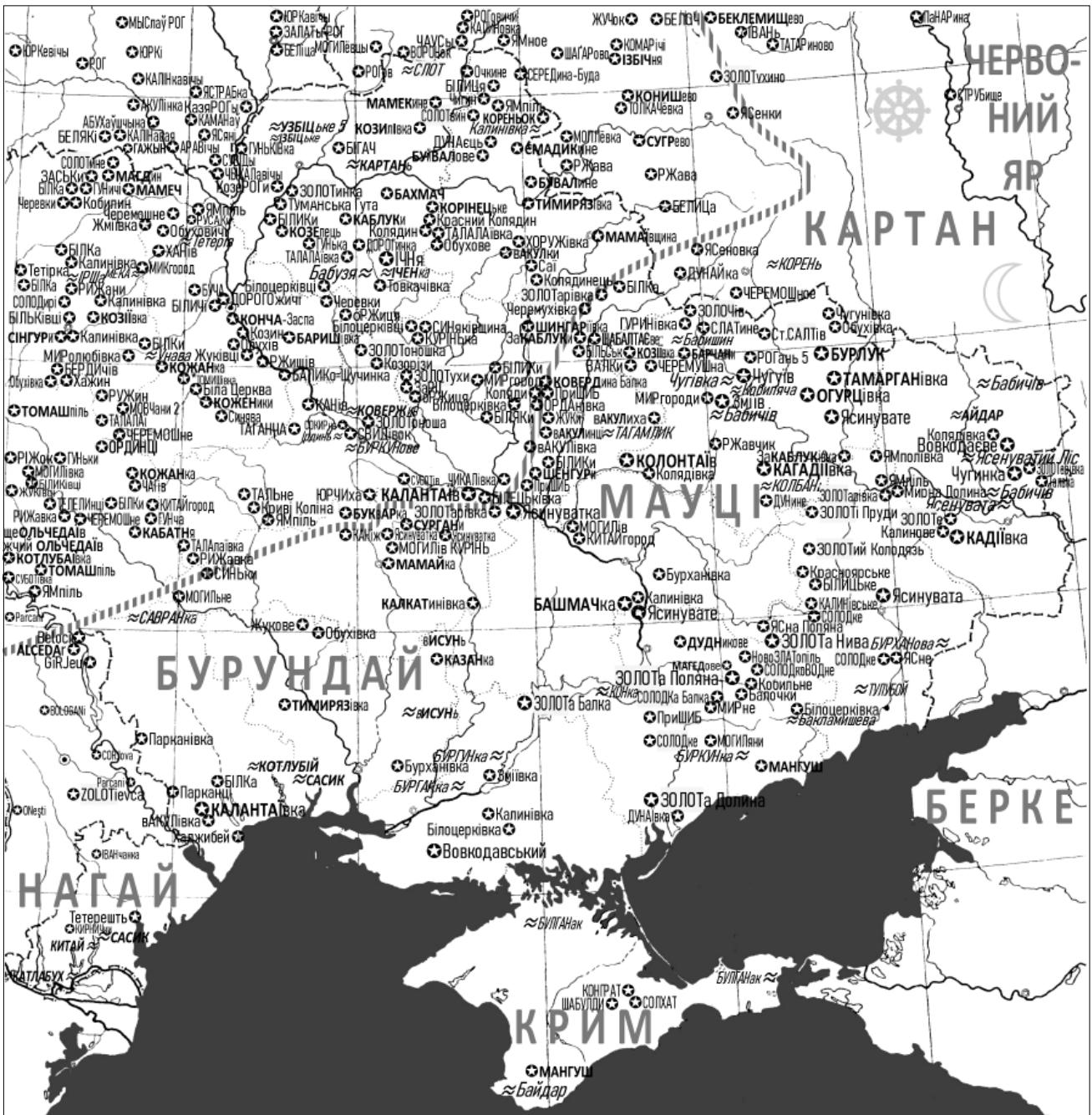
Рис. 1. Масштаби поширення на Лівобережжі топонімів від прототипів часів Золотої Орди:

імен Джучидів, їхніх емірів та супровідних реалій. Пояснення у тексті (вище автор додав у pdf-чіткіший варіант цілої карти. -- К.Т.)