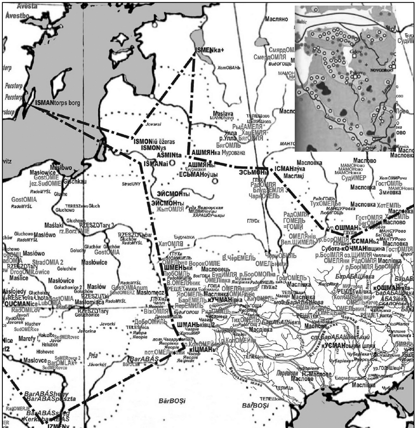
Рис. 2. Назви від основи Есман-/ Кусман- у складі арабського фракталу топонімів Наддніпрянищини і прилеглих земель.

Проникнення арабів степовими шляхами з півдня (траси шляхів показані за [УКМЕ, 559]). На вірзиці – картосхема місць знахідок арабських монет у Прибалтиці (пор. розміщення села на березі Чудського озера Istenka+, тепер Мехикоогта, Естонія)