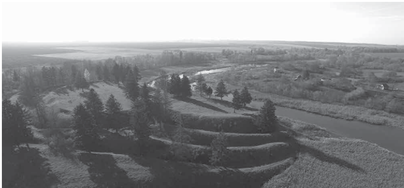
Рис. 2. Трьохрядний оборонний комплекс Північного укріплення Губинського городища. Аерозйомка 2015 року.