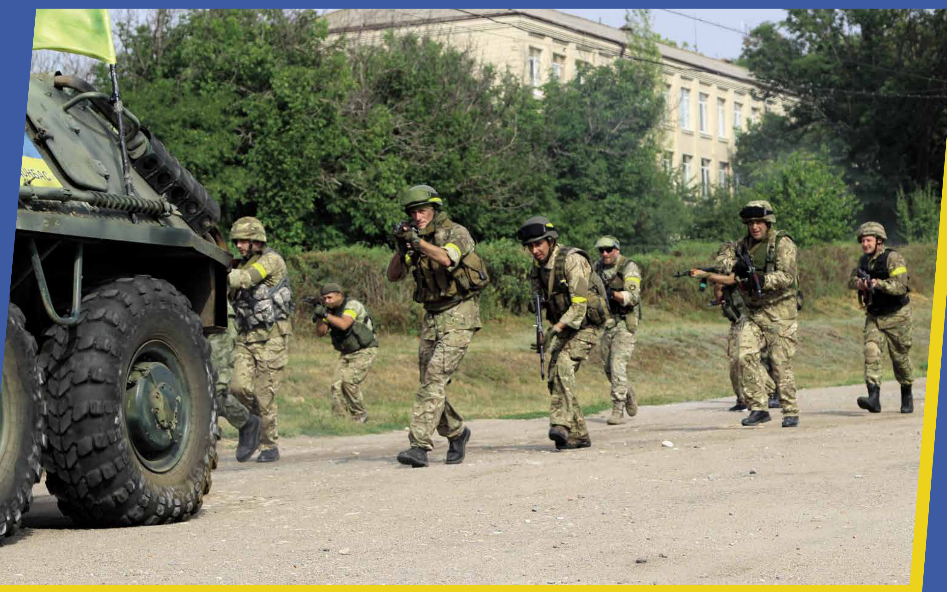
Про перших добровольців знято фільми "Добровольці Божої чоти", "Війна за свій рахунок", "Кіборги", "Іловайськ 2014. Батальйон "Донбас". На фото – кадр із останнього фільму

У травні 2014 року в рамках часткової мобілізації, викликаній російською агресією, було прийнято рішення про створення в кожній області батальйонів ТрО, які входили до складу ЗСУ та підпорядковувалися Міністерству оборони України. Пізніше більшість із них брала активну участь в Антитерористичній операції проти російських регулярних військ та їхніх найманців на Донбасі, звільняючи захоплені окупантами міста.