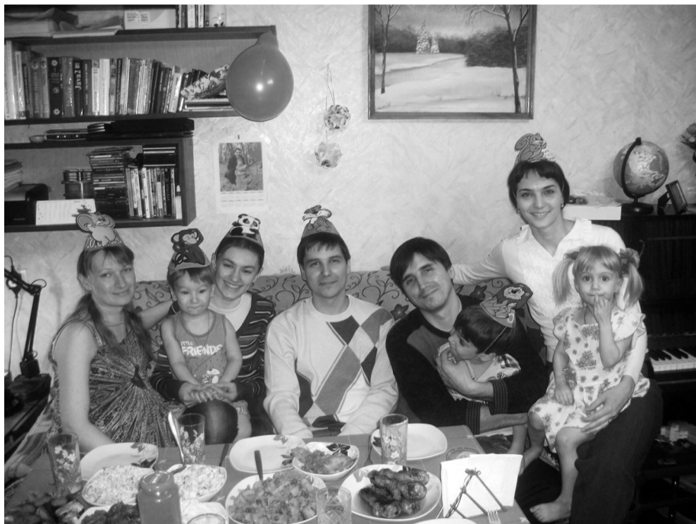
Ми в гостях у Іванового брата. Свята видаються дружними, галасливими. І діти не пов'язують ці веселощі з кольоровими пляшками на столі.