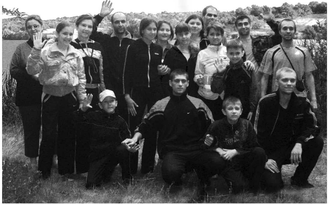
Фото зі З'їзду тверезників України у 2007 році. Усім запам'ятався цей день, 07.07.2007, коли після рясного дощу на небі з'явилися дві веселки

Кожного літа, в середині липня, щасливі люди разом зі своїми родинами відключаються від зовнішнього світу і їдуть відпочивати. Найкраще – туди, де практично відсутній мобільний зв'язок, щоб ніхто не заважав зануритися у живе спілкування з друзями. А там обов'язково будуть і нові приємні знайомства, й задумливе споглядання зірок, розмірковування про життя, самовдосконалення.