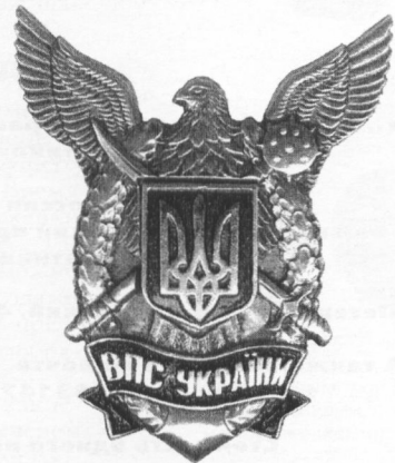
«Пам'ятний знак Військово-Повітряних Сил України»