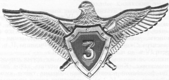
«Військовий льотчик 3 класу»

Не викликає сумніву, що запровадження знаків та емблем сприятиме піднесенню престижу як