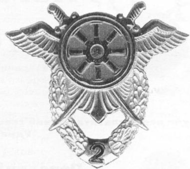
«Фахівець тилового забезпечення 2 класу»