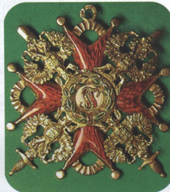
Хрест ордену Св. Станіслава III ступеня з мечами. XX ст.