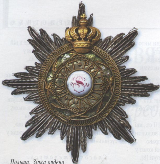
Польща. Зірка ордену Св. Станіслава. XVIII ст.