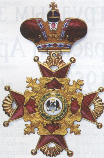
Хрест ордену Св. Станіслава II ступеня з короною для нехристиян. 1844 р.