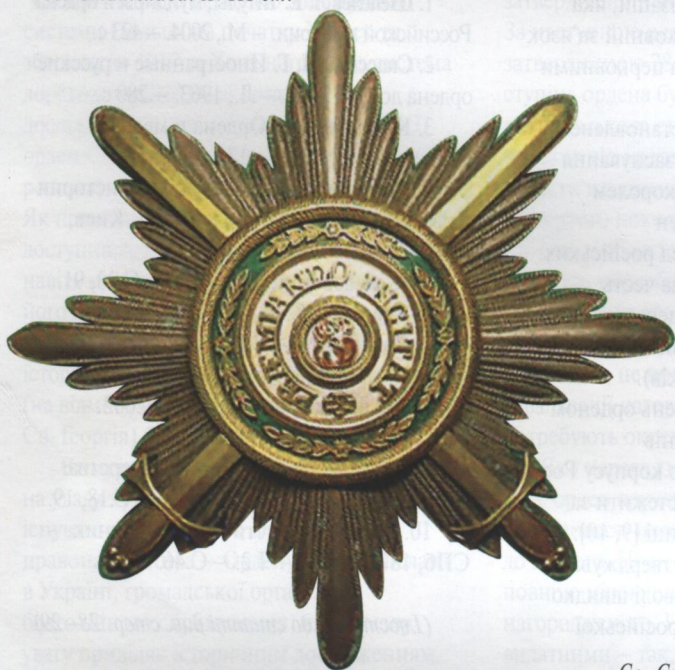
Зірка ордену Св. Станіслава з мечами. Друга половина XIX ст.