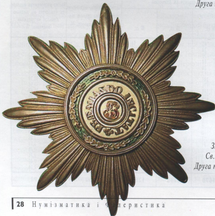
Зірка ордену Св. Станіслава. Друга половина XIX ст.