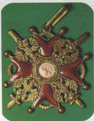
Хрест ордену Св. Станіслава IV ступеня з мечами. XX ст.