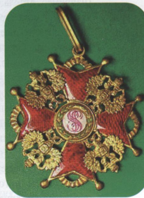
Хрест ордену Св. Станіслава IV. XX ст.