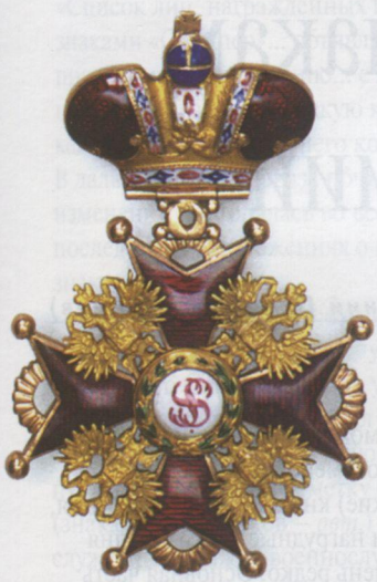
Хрест ордену Св. Станіслава II ступеня з короною. 1868 р.