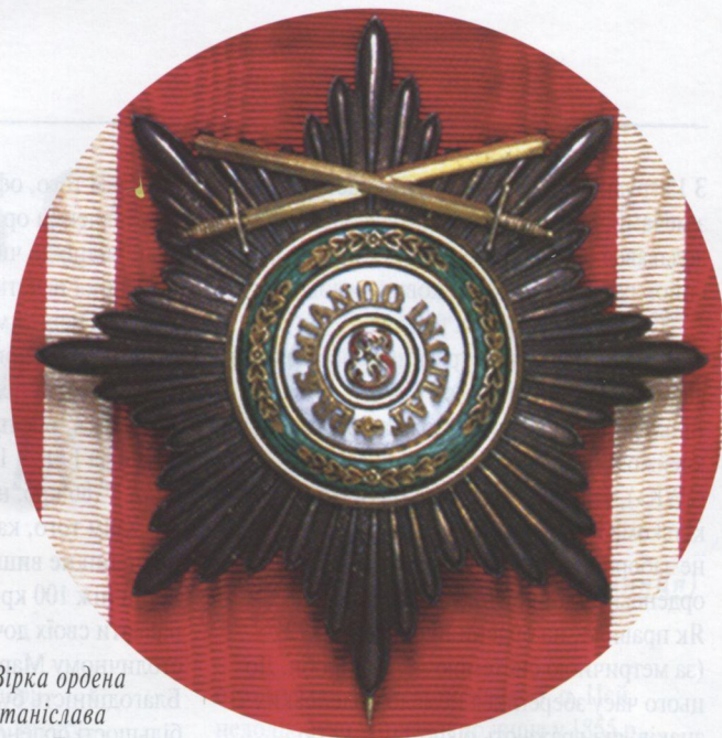
Росія. Зірка ордену Св. Станіслава з мечами. Друга половина XIX ст.