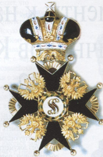
Хрест ордену Св. Станіслава II ступеня з короною для нехристиян. 1844 р.