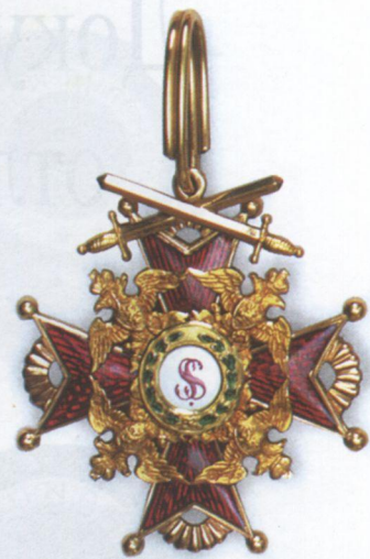
Хрест ордену Св. Станіслава II ступеня з мечами. Середина XIX ст.