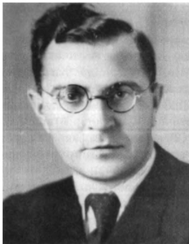
Регей Василь («Кіт») - перший голова Дніпропетровського обласного проводу ОУН(б) у 1941 р., організатор Дніпропетровської обласної управи.