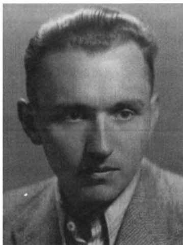
Кук Василь («Юрій Леміш», «Степан») - голова Крайового проводу ОУН(б) ПдСУЗ з червня 1942 р., останній головнокомандувач УПА.