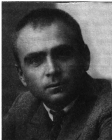
Курило-Кримчак Іларіон - член Мелітопольського міського та окружного проводу ОУН(б), в'язень нацистських концтаборів, розстріляний у 1947 р.