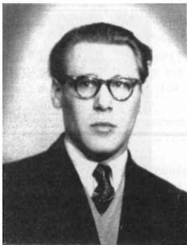
Полтава Леонід – учасник підпілля ОУН(б) на Роменщині, після війни – відомий письменник української діаспори, редактор кількох видань.