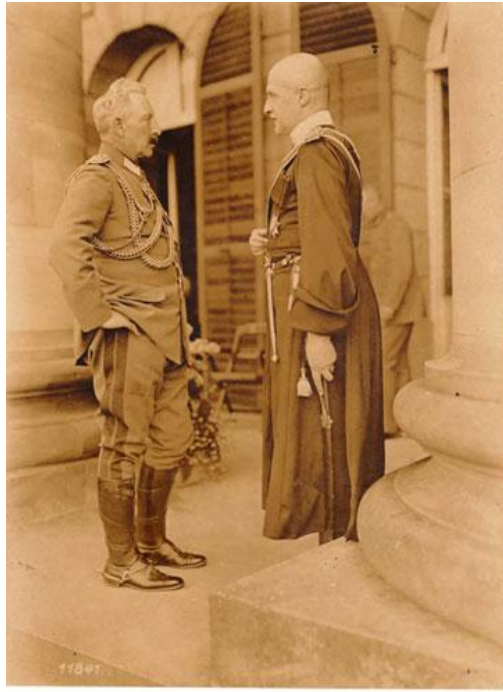
Рис. 2. Кайзер Вільгельм II і гетьман П. Скоропадський (5 вересня 1918 р.)

«Його Світлістю Ясновельможним Паном Гетьманом всієї України», адже саме так називав його імператор Вільгельм. Після Берліна поведінка німецьких представників в Україні також зазнала певних змін. Після того, як у Берліні німецькому послу А. фон Мумму в імператорській ложі театру було вказано сидіти за спиною гетьмана, його раніше зверхній тон змінився на лагідний. Після повернення гетьмана німецький командувач власною персоною з'явився аби дізнатися, коли П. Скоропадський зможе його прийняти. До цієї поїздки німецький командувач сам призначав гетьманові час зустрічі. 7