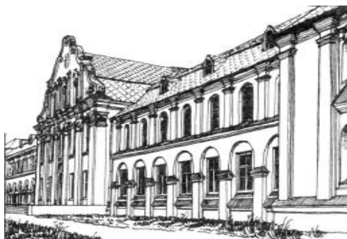
Споруда лісотехнічного факультету Української сільськогосподарської академії.

Після цих буремних і трагічних подій, у середині 20-х рр. мистецьке життя потроху почало відроджуватись. Відновився й розвиток української національної архітектури. На хвилі НЕПу та “українізації”, які збігли у часі з певним “послабленням” тоталітарно-репресивного більшовицького апарату, з'явилося чимало зразків українського необароко. Яскравим представником тогочасного зодчества став Д.Дяченко. За короткий час він “встиг” збудувати споруди, які стали знаковими в історії нашої архітектури. Найбільшим здобутком автора став комплекс Української сільсько-господарської академії у Голосієвому лісі м.Києва (1923 – 1929). Пізніше з'явився будинок на вул. Пушкінській (1930).