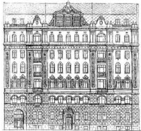
Будинок Альошина у Києві.

Серед інших будівель у дусі українського бароко можна назвати семиповерховий житловий будинок Ф. Альошина на Софійській площі у Києві (1914 р., арх. П. Альошин). У даному випадку зодчий вдало розмістив велику споруду між двома видатними пам'ятками української барокової архітектури – комплексами Софійського та Михайлівського Золотоверхого монастирів. У подібних формах було зведено будинки Міського народного училища у Чернігові (1912 р., арх. І. Якубович), земської лікарні у Лубнах (1913 – 1915 рр., арх. Д. Дяченко). Продовженням культового будівництва у стилі бароко стало спорудження церкви-пам'ятника на Козацьких могилах під Берестечком (1911 – 1914 рр., арх. В. Максимов). У той час було розроблено багато цікавих проектів, що не були реалізовані. Наприклад, споруда друкарської школи у Києві (арх. Г.Лукомський). Поступовому розвитку українського необароко завадила перша світова війна, революція та громадянська війна в Україні.