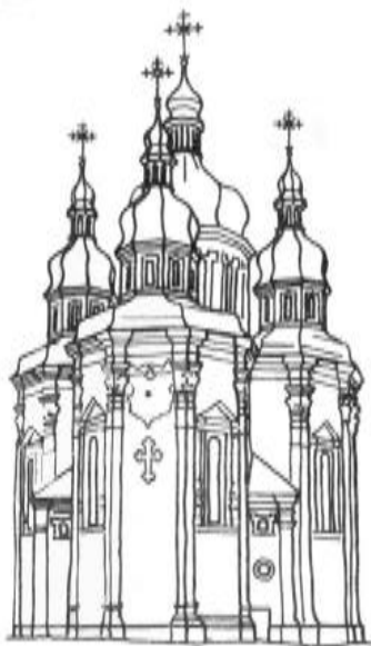
Георгіївський собор Видубицького монастиря.

Не менш своєрідним став тридільний тип церков. Такі храми склалися з трьох частин, кожна з яких, як правило, завершувалася бачею. До такого типу належать Вознесенська церква Флорівського монастиря у Києві, Георгіївський собор у Данівці, Покровський собор у Харкові, Микільська церква у Глухові тощо.