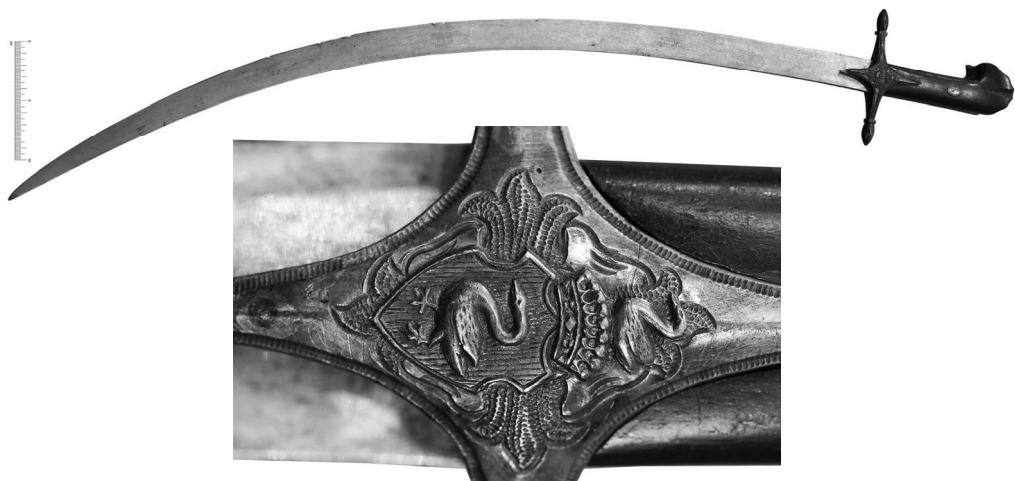
Рис. 3. Шабля Дуніних-Борковських (польська гілка), перша половина ХІХ ст., Дніпропетровський національний історичний музей ім. Д.І. Яворницьького, інв. № О-249.

На нашу думку, усе ж має йтися про першу третину ХІХ ст. Судячи з усього, шаблю оправлено невдовзі після отримання представниками польської гілки Дуніних-Борковських графського титулу, за задумом виробника — у стилі «старої» орієнталізованої зброї, що наслідує постбарокові традиції.