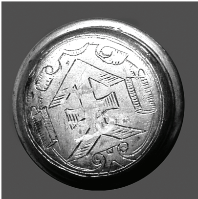
Рис. 1. Пернач, XVII ст., з колекції Переяслав-Хмельницького державного історичного музею, інв. № 647.