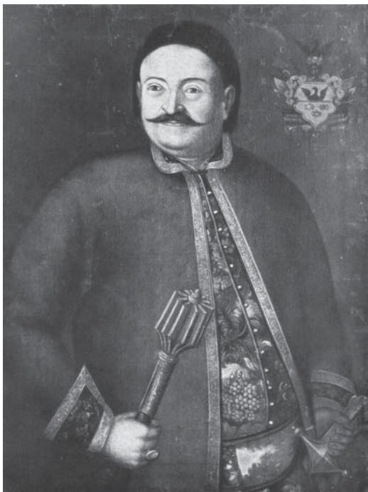
Рис. 9. Портрет переяславського полковника Семени Сулими (1754). НХМУ.