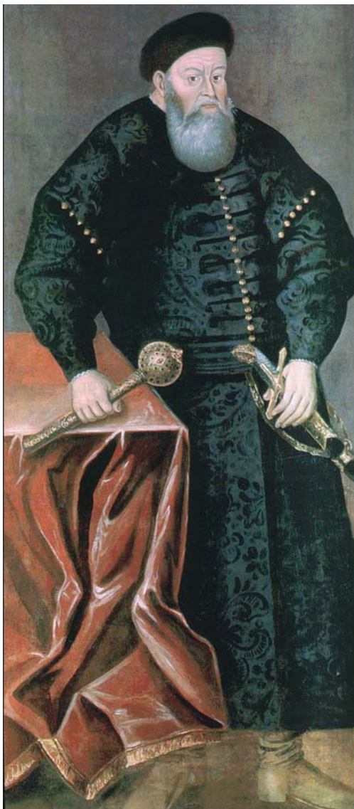
Рис. 2. Портрет великого гетьмана литовського Костянтина Острозького (копія XVIII ст. з портрета пер. пол. XVII ст.). Національний музей історії і культури Республіки Білорусь (м. Мінськ).

Інформацію щодо «плебейської» природи булав та їх застосування можна віднайти також у писемних джерелах, хоча й більш пізнього періоду. Так, Псковський літопис 1502 р., описуючи битву з орденськими рицарями, відзначає, що «...не саблями светлыми секоша их, но биша их москвичи и татарове аки свиной шестоперами...» [2, с. 211].