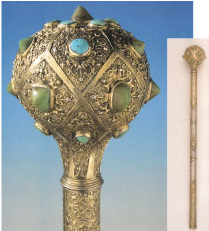
Рис. 7. Булава, XVII ст., Угорщина. Колекція Національного музею Угорщини, інв. № 54.1470.

лося у поверненні в Україну булави як ознаки військової та цивільної влади. Адже в Османській імперії та Персії традиція закріплення за булавою функції уповноваження владної особи протягом Ранняго Нового часу набув найвищого розвитку. Так, з булавою, як символом влади козацької старшини, нерозривно пов'язана історія започаткування козацьких клейнодів. Зокрема булава була серед перших клейнодів, переданих козацькому війську польським королем Стефаном Баторієм 1583 р. [12].