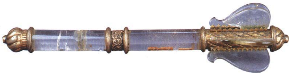
Рис. 13. Пернач, XVIII ст. Колекція Чернігівського історичного музею ім. В. В. Тарновського, інв. № И-4522.

Детальне дослідження козацьких булав, що зберігаються у державних та приватних музеях має стати справою найближчого майбутнього.