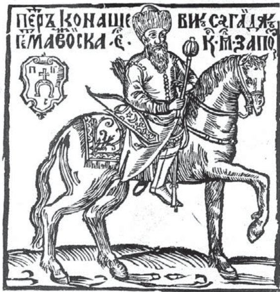
Рис. 3. Петро Конашевич Сагайдачний, гетьман Війська його королівської милості Запорозького. Гравюра з книги К. Саковича «Вірші на жалосний погреб зацного рицера Петра Конашевича Сагайдачного», 1622 р.

хідноєвропейських бойових традицій, засвоєних разом з європейською рицарською мілітарною технологією. Остання зросла на основі воєнної культури вікінгів-норманів до початку XII ст., згодом поширившись на весь Християнський світ. Саме в її руслі формувалася європейський комплекс рицарської холодної зброї.