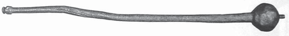
Рис. 1. Булава бойова XVI ст. Черкаський обласний краєзнавчий музей, № ЗС-514. Знайдена в с. Скотареве Черкаської обл. Залізо, лиття, кування. Довжина 475 мм [20, с. 203].

Класична бойова булава з яблуком круглої, грушовидної або призматичної форми на держаку, призначена, насамперед, для розбивання ворожого обладунку. Найдавніші яблука кулястої форми вироблялися з різних сортів каменю, пізніше – бронзи, заліза, навіть дорогіших металів.