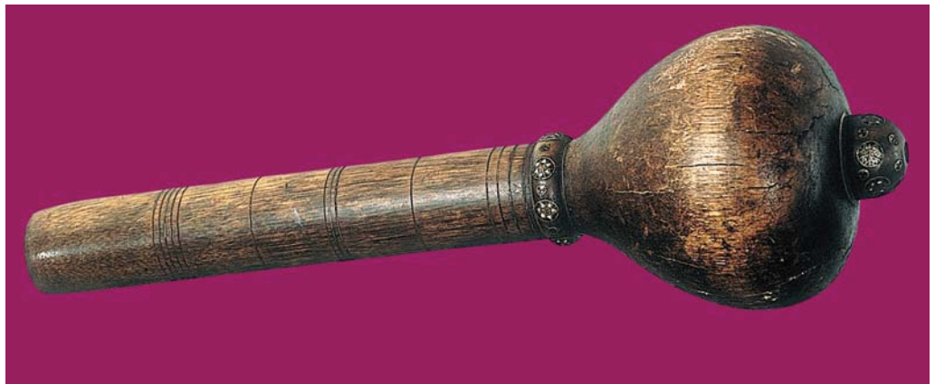
Рис. 4. Булава, Османська імперія, XVII ст. Музей Війська Польського, інв. № 6134 (ш. 21332).

Як бачимо, меч перекрив усі основні соціо-культурні та сакральні ніші, зайняті булавою у попередні часи, та навіть захопив нові, У якості міжнародного символу рицарської звитяги, нерозривно поєднаного з споконвічним поняттям рицарства, саме меч зберігав