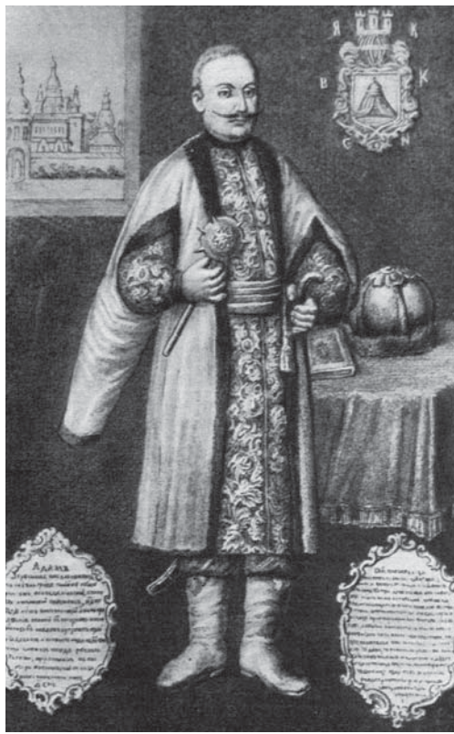
Рис. 6. Портрет київського воєводи Адама Кисіля (копія з портрета 1630-х рр.). Оригінал втрачено.

Статус «українського рицаря» тісно пов'язаний з традиційним комплексом рицарського озброєння. Відтак, булави протягом XV – початку XVI ст. продовжували залишатися у тіні клинкової та інших різновидів деревкової зброї. Відомі на сьогоднішній день нечисленні зразки цього періоду – це, насамперед, скромні, суто прагматичні бойові конструкції зі залізними держакми і важкими яблуками переважно округлої форми.