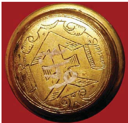
Рис. 11. Пернач XVII ст. з колекції Переяслав-Хмельницького державного історичного музею, інв. № 647.