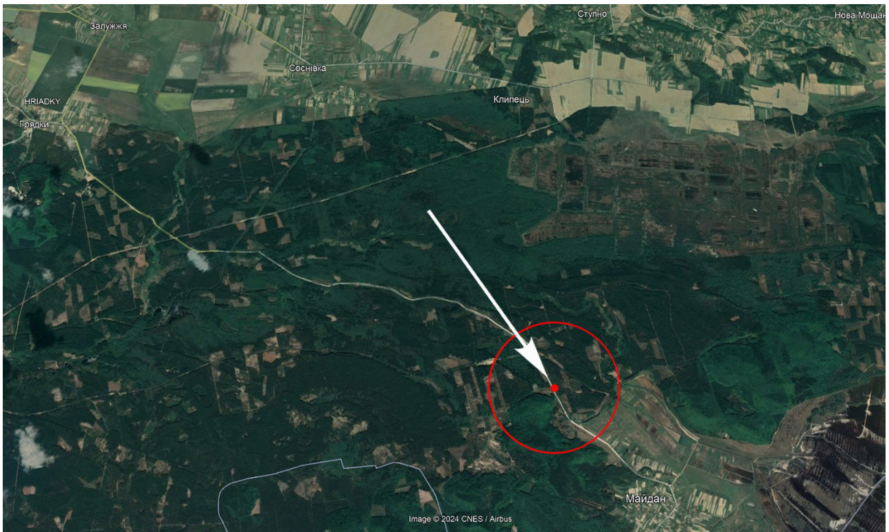
Рис. 1. Археологічне місцезнаходження Майдан-4, де було знайдено посудину. Супутниковий знімок місцевості на карті Google Earth.

Майже аналогічний майданському орнамент виявлено на уламку посудини з поселення Тартак-2, яке знаходиться за 12 км на схід від місця знахідки. Там же виявлено чимало вінчиків посудин подібної форми. На жаль датування цієї знахідки утруднене* із-за її самотності, подальші ж розвідки цієї місцевості ускладнені із-за її заліснення.