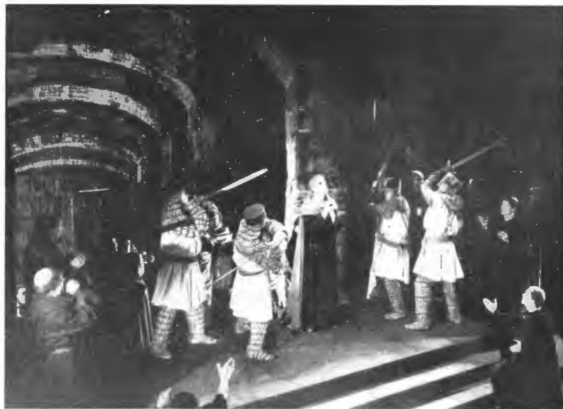
«Вбивство у Соборі». Вистава театру «Олд Вік», Лондон, березень 1953. Томас — Роберт Донат

“Murder in the Cathedral”. The production at the Old Vic Theatre, March 1953. Thomas: Robert Donat.