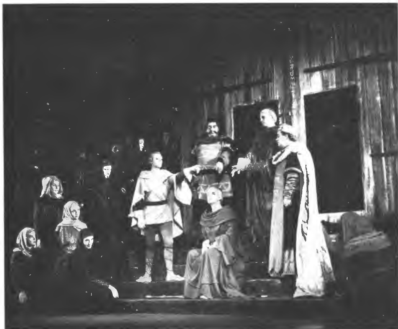
«Вбивство у Соборі». Вистава театру «Олд Вік», Лондон, березень 1953. Томас — Роберт Донат

“Murder in the Cathedral”. The production at the Old Vic Theatre, March 1953. Thomas: Robert Donat.