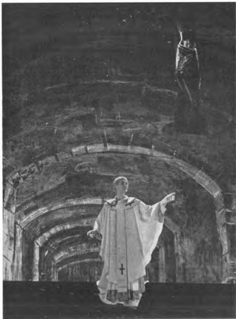
«Вбивство у Соборі». Вистава театру «Олд Вік», Лондон, березень 1953. Томас — Роберт Донат

“Murder in the Cathedral”. The production of the Old Vic Theatre, March 1953. Thomas: Robert Donat.