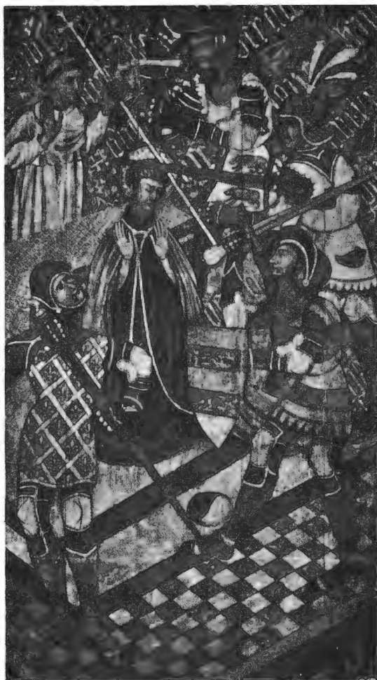
Мучеництво св. Томаса Кентерберійського. Реконструкція проф. Е. В. Трістрама (настінний живопис у головах гробниці Генрі IV у Кентерберійському Соборі, бл. 1415)