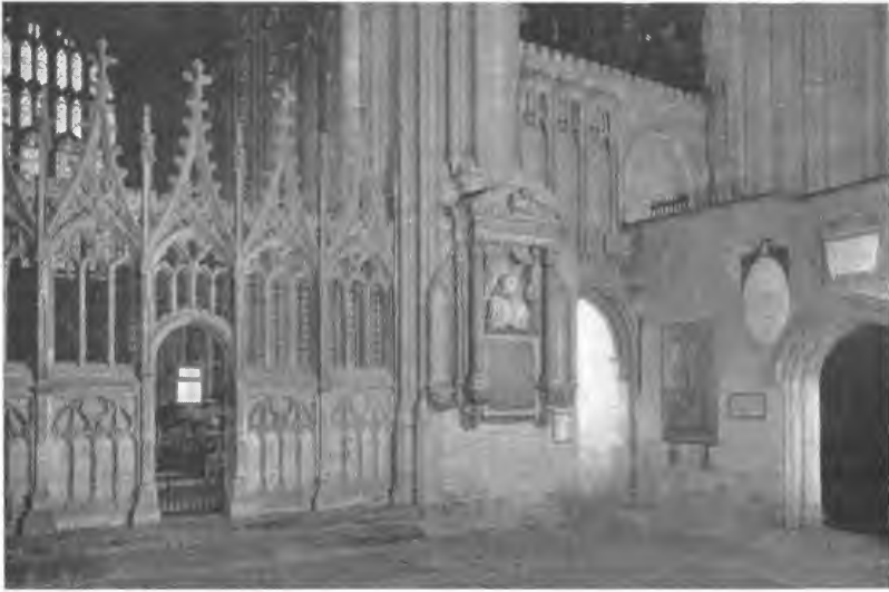
Кентерберійський Собор. Каплиця Мучеництва та Деканова каплиця Canterbury Cathedral. The Martyrdom and the Dean's Chapel