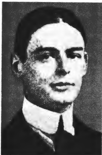
Т. С. Елиот. Фото бл. 1910