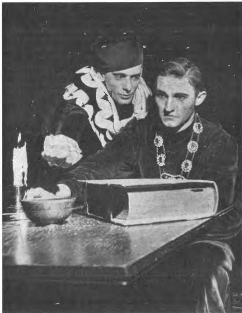
«Вбивство у Соборі». Вистава Гобартського коледжу, Женева, Н. Й., США, вересень 1945

"Murder in the Cathedral". The Hobart College production, Geneva, N. Y., U. S. A., September 1945