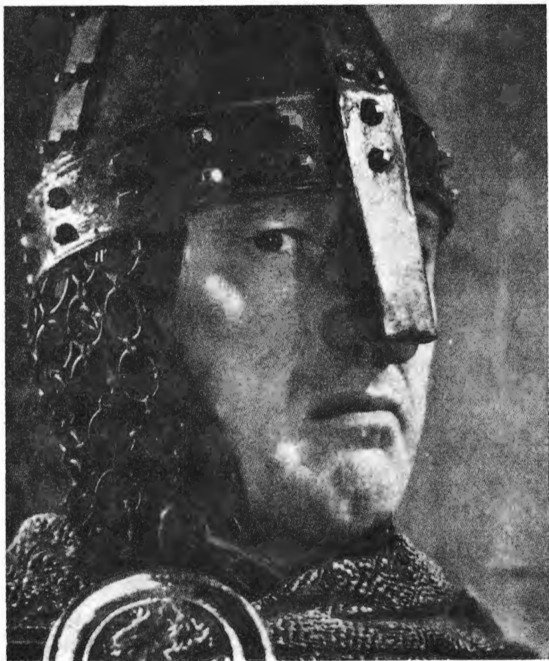
Кадр з фільму «Вбивство у Соборі» (за участю Джорджа Геллерінга), 1951

A picture from the Film of "Murder in the Cathedral" (with George Hoellering). Photo Archive Biennale, Venice, 1951