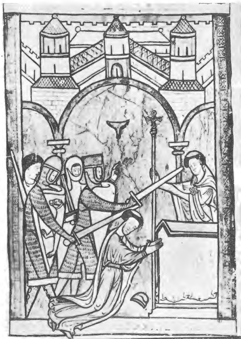
Мучеництво св. Томаса Кентерберійського. Мініатюра з одного латинського псалтиря, бл. 1200

Martyrdom of St. Thomas of Canterbury. Miniature from a Latin psalter, c. 1200