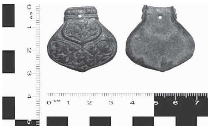
Рис. 7. Словіта. Бронзове завершення ременя. XVII ст. Фонди Словітського історико- краєзнавчого музею.