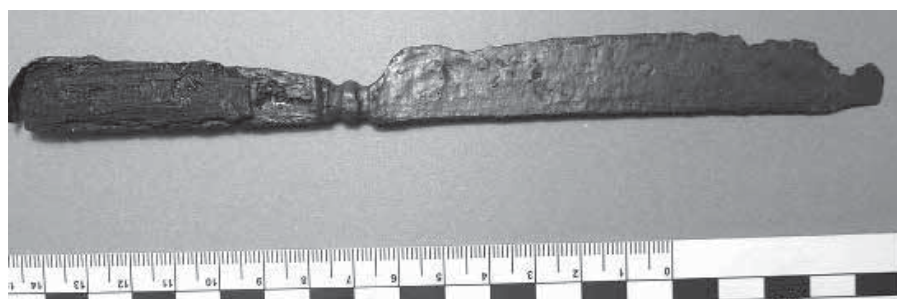
Рис. 6. Ніж з дерев'яним руків'ям. Словіта. II половина XVII ст. Розкопки 2019 р.