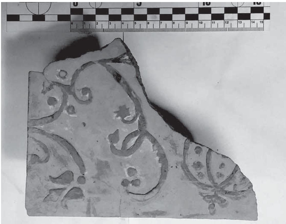
Рис. 2. Фрагмент кахлі без поливи. Словіта. II половина XVII ст. Розкопки 2019 р.