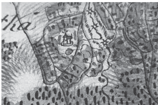
Рис. 1, 1а. Фрагменти мап із планом монастирських будівель. 1779–1783 рр.