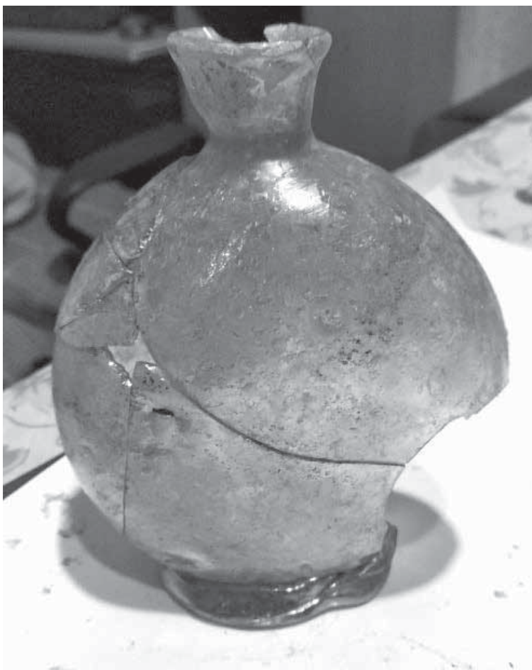
Рис. 3. Плесканка. Скло. Словіта. II половина XVII ст. Розкопки 2019 р.