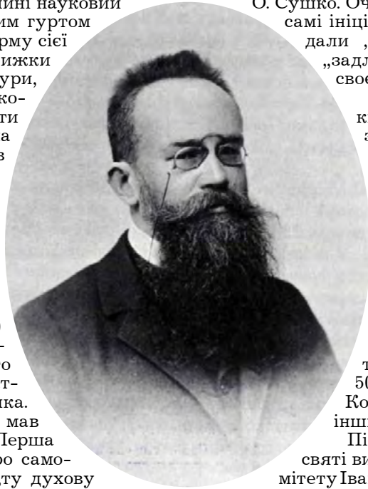
Михайло Грушевський. 1906 р.

згадавши також про численні перешкоди, котрі довелося у своїй діяльності долати М. Грушевському. Відзначимо, що про зміст виступу І. Франка ми сьогодні знаємо лише зі слів В. Гнатюка, тож наведемо дещо довшу цитату: „Він [М. Грушевський] став у нас не тільки репрезентантом української науки на університетській кафедрі, не тільки організатором наукової праці в семінарії та в секціях Наукового Тов[ариства] ім. Шевченка, не тільки центром оживленого наукового і літературного руху на нашій частині України. В ньому ми шануємо ще щось більше, бо чоловіка ясної, критичної думки та чистого і незломного характеру. Він із сього погляду став узором нашого молодого покоління і замінним чинником у нашім