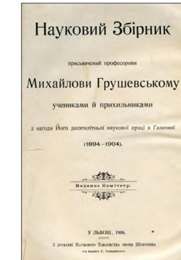
Титульна сторінка Наукового збірника, присвяченого М. Грушевському. Львів, 1906 р.

Відзначимо, що якщо саме свято не вийшло поза межі Галичини, то значно більший резонанс мав виданий об'ємний „Науковий збірник“, в якому взяли участь усі відомі представники тогочасної української гуманістики, а серед них — майже половина учнів М. Грушевського. У „Передмові“ до збірника, котру підписали члени оргкомітету, прозвучали перші узагальнені оцінки наукової праці М. Грушевського. Його приїзд до Галичини було названо „історично-важним фактом“, а діяльність — „головним осередком, коло якого згуртувалися відокремлені давні й нові сили“. Внаслідок їхньої солідарної праці „українська історія, література, етнографія й етнологія, а за ними інші науки, навіть природописні, перестали лежати облогом, або ледви примітивно обробленим полем, як було доси“. Не менш вагомим, йшлося в передмові, був вплив М. Грушевського на громадське життя. Відзначили організатори ювілею й національне значення „Історії України-Руси“ — „величавої основи української історичної науки і невичерпаного жерела національно-політичного і соціально-культурного самопізнання й освідмлення, що вводить нас дійсно вперше в сім'ю європейських народів...“ 18