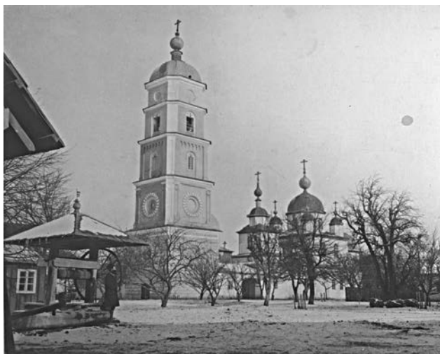
Покровський чоловічий монастир на початку ХХ ст.