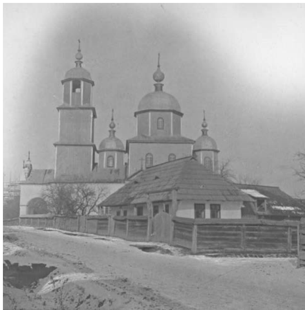
с. Біла Криниця на початку ХХ ст.

дослідників, зокрема служителя губернського правління у Львові С. Бредецького. У праці «Липовани і меноніти у Австрії» автор робить помилкові висновки, зараховуючи старообрядців до менонітів. В 1863 р. у світ виходить інше невелике дослідження В. Гелерта «Липовани в Буковині». В 80–90-ті роки ХІХ ст. пошуковці друкують декілька статей присвячених у т. ч. білокриницьким старовірам. На достатньо високому науковому рівні були виконані роботи Ф. Віккенгаузера, який у редактованих ним збірниках опублікував кілька десятків документів з історії буковинського старообрядства. В 1885 р. доктор філософії Чернівецького університету Й. Полек видав статтю «Липовани в Буковині», де в т. ч. досліджував історію Білої Криниці 5 . Однак самою відомою роботою на цю тему стало фундаментальне дослідження професора австрійської історії Чернівецького університету Р. Кайндля «Возникновение и развитие липованских поселений в Буковине», де Білій Криниці автор присвятив окремий розділ.