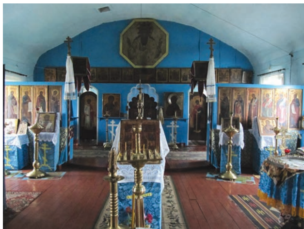
Интер'єр Микільського храму в с. Біла Криниця. Фото 2016 р.

Там перебудували Покровський собор, возвели зимовий храм на честь Миколи Чудотворця, а також великий братський корпус. У 1899 р. за сприяння митрополита Афанасія чоловічий монастир відкрив своє представництво на Головній вулиці Чернівців.