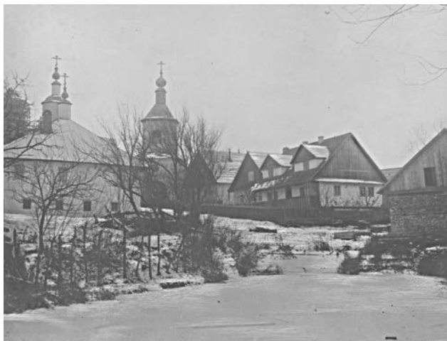
Успенський жіночий монастир на початку ХХ ст.

Значну дослідницьку роботу виконав чиновник слідчої поліції І. Аксаков, який за доручен-