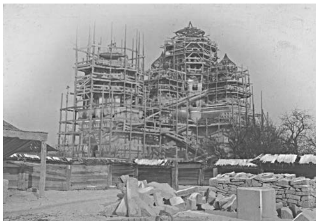
Будівництво Успенського кафедрального собору на початку ХХ ст.

У 1843 р. Павло Великодворський звернувся з клопотанням до австрійського імператора Фердинанда I, у якому вказав на необхідність заснування для липованів, котрі мешкають в Австрійській імперії, окремої архієрейської кафедри. Він дав зрозуміти австрійським чиновникам, що виконання цього прохання буде неприсним для Росії, однак, незважаючи на це, білокриницька делегація отримала від уряду дозвіл. Можливість утримання старообрядцями власного митрополита стала головною умовою дозволу на заснування старообрядської митрополії на Буковині.