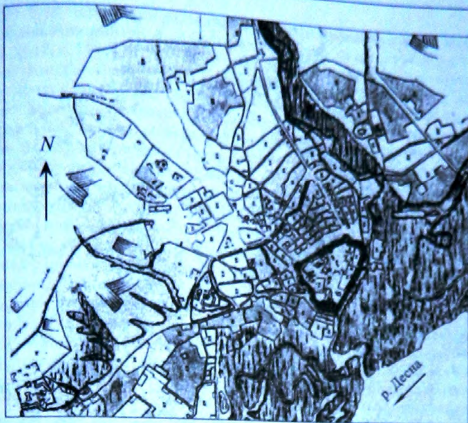
Рис. 1. План Чернігова 1797–1802 рр.

Богоугодных заведений; через Ковалевку вал выходил на Ростиславскую ул. (следы на Елецком огороде) и от «Пяти углов», огибая городскую усадьбу сборного пункта, усадьбу земства, Снигиревой и губернаторскую, вал шел к Красному мосту» [Очерк, 1908, с. 34 – 35].