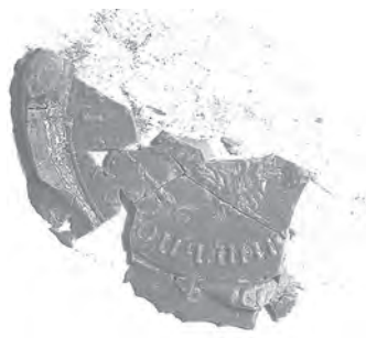
Мал. 13. Печатка дирекції училищ Подільської губернії