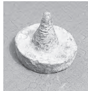
Мал. 8–9. Печатка Чернігівської дирекції училищ