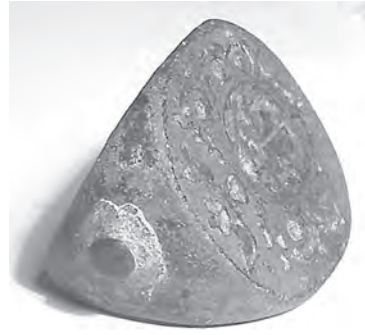
Мал. 4. Печатка невідомого