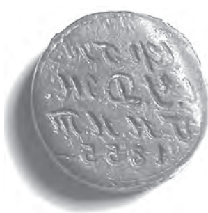
Мал. 18. Печатка невідомого ГННТ