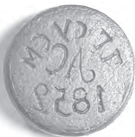
Мал. 14. Печатка невідомого