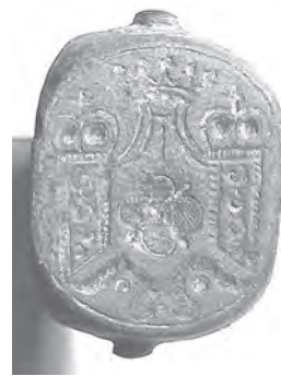
Мал. 5–7. Печатка невідомого