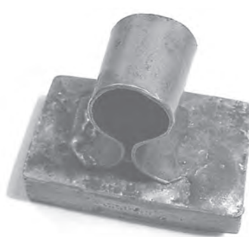
Мал. 20–21. Печатка Гірши Кравця