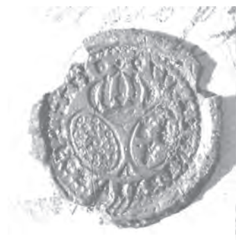
Мал. 2. Печатка Никифора Кармазіна