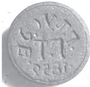
Мал. 15. Печатка невідомого