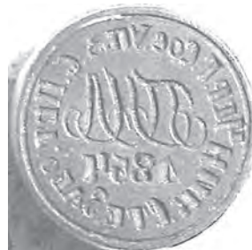
Мал. 16. Печатка невідомого