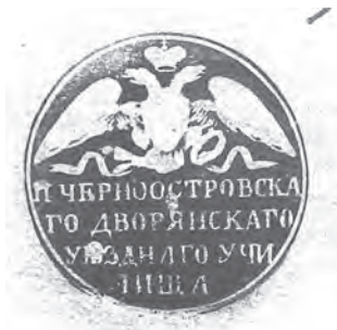
Мал. 10. Печатка Черноострівського повітового училища