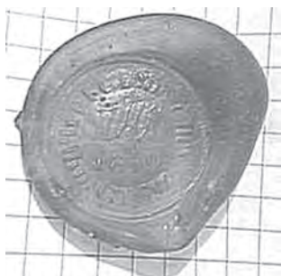
Мал. 17. Печатка невідомого (на склі)