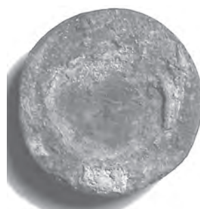
Мал. 19. Печатка невідомого ГННТ