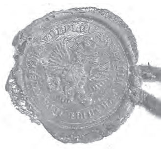
Мал. 11. Печатка дирекції училищ Чернігівської губернії