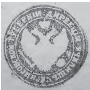
Мал. 12. Печатка дирекції училищ Чернігівської губернії. Варіант