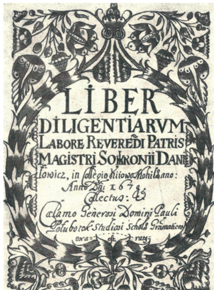
Палітурка зошита П.Полуботка, 1679 р.

Поет Лаврентій Крщонович у вірші, написаному 1685 року, так пояснював символічне навантаження різних гербів, які використовувалися в Гетьманській Україні: