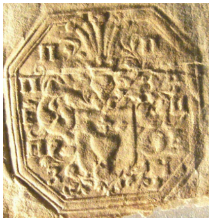
Печатка Павла Полуботка, 1713 р.

Свою вишуканість вирізнялася печатка Павла Полуботка: „Шкатулка зеленая, обита желѣзом бѣлым, в ней 7 ящичков, в оных ящичках положено: один перстень золотой, въ нем камень аматистовой, по краямъ того перстня искры яхонтовые красные, на камнѣ вырѣзано его Полуботковъ гербъ...” 10 . На жаль, доля цього артефакту невідома. Проте, уявлення про нього дає відбиток на листі полковника до Ганни Забіли від 8 травня 1713 року. Печатка паперово-воскова, на червоному воску, восьмикутна, 33x31 мм. Зображення: у щиті увінчане хрестом серце, пробите двома стрілами вістря униз, над щитом коронований шолом з