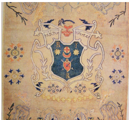
Герб Павла Полуботка на його килимі