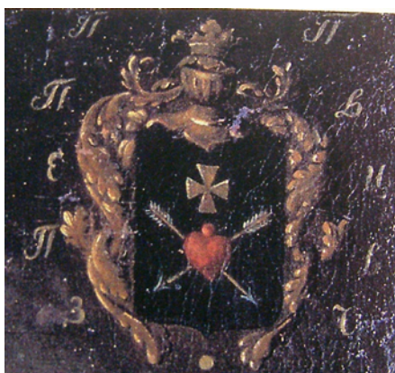
Герб Павла Полуботка на сулімівському портреті

печатка не опублікована. Проте, можна припустити, що жінка користувалася печаткою з гербом чоловіка або свого батька, ніжинського полкового судді Романа Лазаревича. Тим паче, що їхні герби схожі: на печатці Лазаревича 1716 року було зображене простролене стрілою серце, з якого росте квітка 17 .