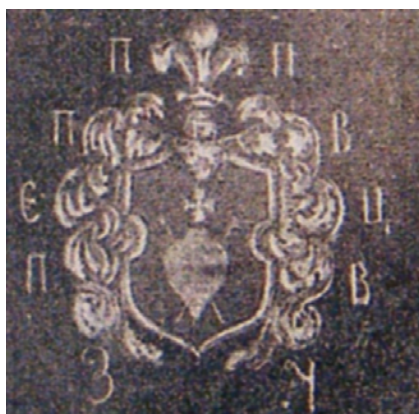
Герб Павла Полуботка на чернігівському портреті