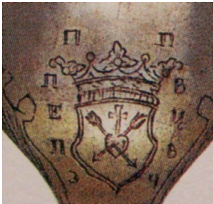
Герб Павла Полуботка на ложці

серце, простролене двома стрілами вістрями униз, на серці – хрест; над щитом – корона; навколо зображення абrevіатура: П П П В Е Ц П В З Ч („ПАВЕЛ ПОЛУБОТОК ПОЛКОВНИК ВОЙСКА ЕГО ЦАРСКОГО ПРЕСВѢТЛОГО ВЕЛИЧЕСТВА ЗАПОРОЖСКОГО ЧЕРНИГОВСКИЙ”) 9 .