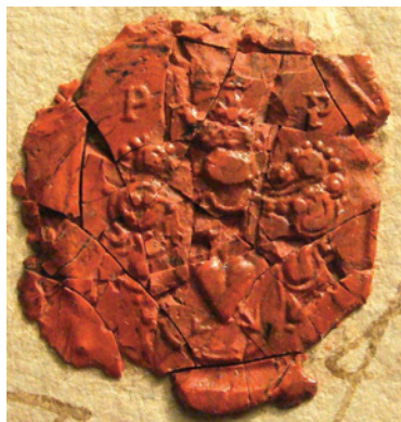
Печатка Андрія та Якова Полуботків, 1725 р.

Звертає на себе увагу матеріал. На відміну від поширеного на Гетьмашині срібла, золото використовували значно рідше. Наприклад, для Михайлівської церкви с. Красилівки 16 січня 1750 року священник Лук'ян Марков та ктитор Лук'ян Якубенко купили срібла 10 проби 50 лотів, тобто 640 гр, ціною 17 рублів 50 коп. (лот = 12,8 гр, по 35 коп. за лот). З нього були виготовлені келех, дискос і зірка. Для позолочення цих речей придбали всього півтора лота червоного золота, тобто 5,25 гр, ціною 3 рублі 30 коп. (червоний = 3,5 гр, по 63 коп. за гр). За роботу золотар взяв за лот по 12 коп., тобто 6 рублів. Загалом за золото, срібло і роботу майстра заплатили 26 рублів 80 коп. Та за келех ще додали 5 рублів. Разом витратили 31 рубель 80 коп. 14 6 лютого 1764 року для тієї самої церкви була виготовлена срібна дарохранильниця вагою півтора фунта (фунт = 409,5 гр) та 4 лоти, тобто 665,45 гр. Матеріали і робота виявилися значно дорожчими. За срібло вже 12 проби запла-