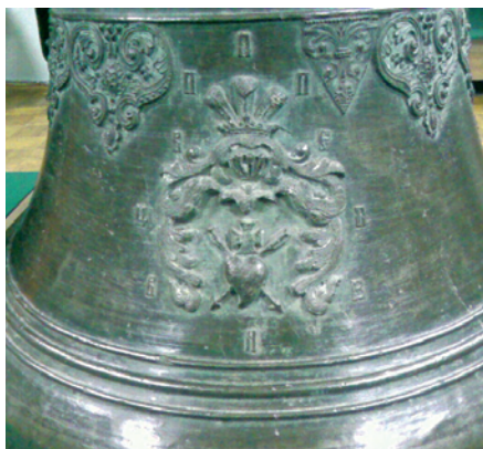
Герб Павла Полуботка на дзвоні