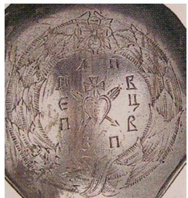
Герб Леонтія Полуботка на ложці