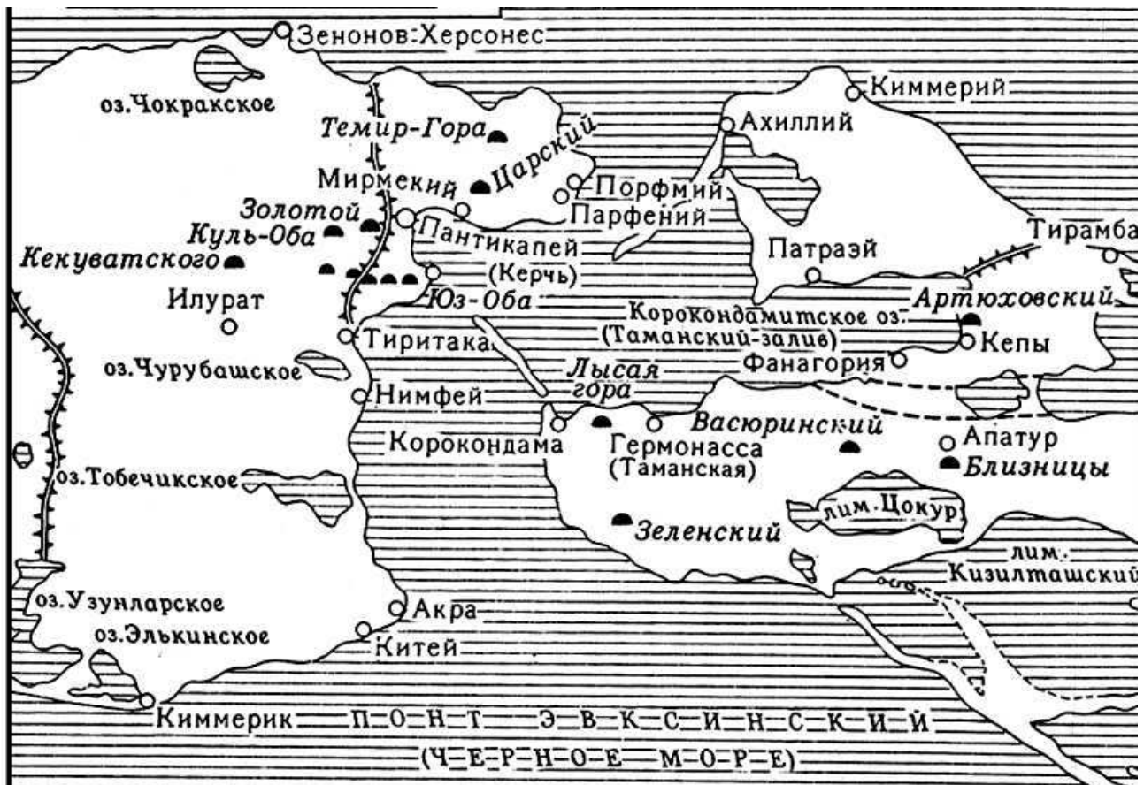
Боспорська держава у IV – II ст. до н.е.

У Боспорському царстві центром державного апарату був двір царя, де вирішувалися всі питання управління, який охоплював найближче оточення правителя – аристократів. Особливу роль серед них відігравали дворецький та особистий царський секретар. Існувала також велика кількість різноманітних управителів: царський скарбничий, краватарії на чолі з архікойтоном, управляючий конюшнею, начальник євнухів, інші придворні чини. Зв'язки з місцевими племенами та сусідніми державами забезпечували спеціальні чиновники під керівництвом головного перекладача. Управління найважливішими областями і містами країни доручалося царським намісникам.