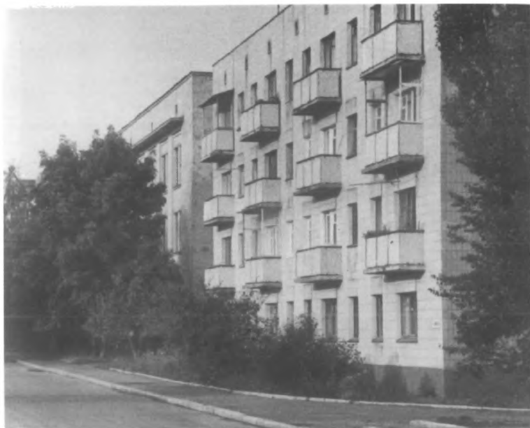
Вулиця ім. В. Симоненка в Черкасах.