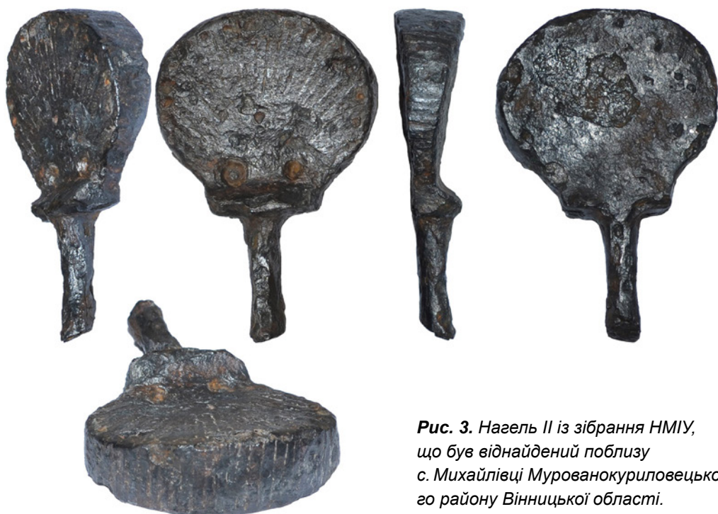
Рис. 3. Нагель II із зібрання НМІУ, що був віднайдений поблизу с. Михайлівці Мурованокуріловецького району Вінницької області.