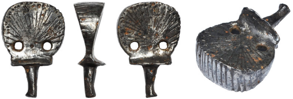
Рис. 6. Нагель V із приватного зібрання Є. Гредунова.

до країв радіально розходяться лінії, а на торці нанесені поперечні лінії. У профіль нагель має широкий (20,5 мм) верх, що поступово симетрично зменшується донизу (до 5,5 мм), а потім розширюється до підпрямокутної основи (19 на 16,5 мм). Стрижень, що фіксується в руків'ї корду має довжину 26 мм, а його діаметр коливається від 7,5 до 4 мм. Загальна висота нагеля – 58 мм, найбільша ширина – 37 мм, діаметр отворів – 5 мм. Вага – 77 г.