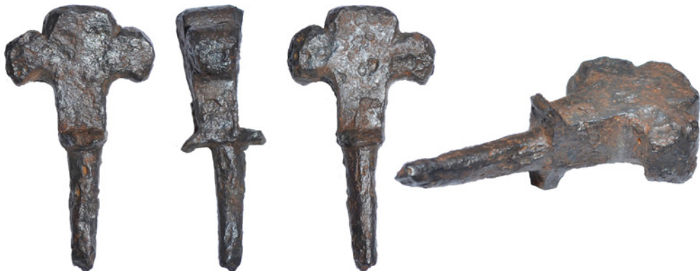
Рис. 10. Нагель IX із зібрання НМІУ, що був віднайдений поблизу с. Величківка Менського району Чернігівської області.