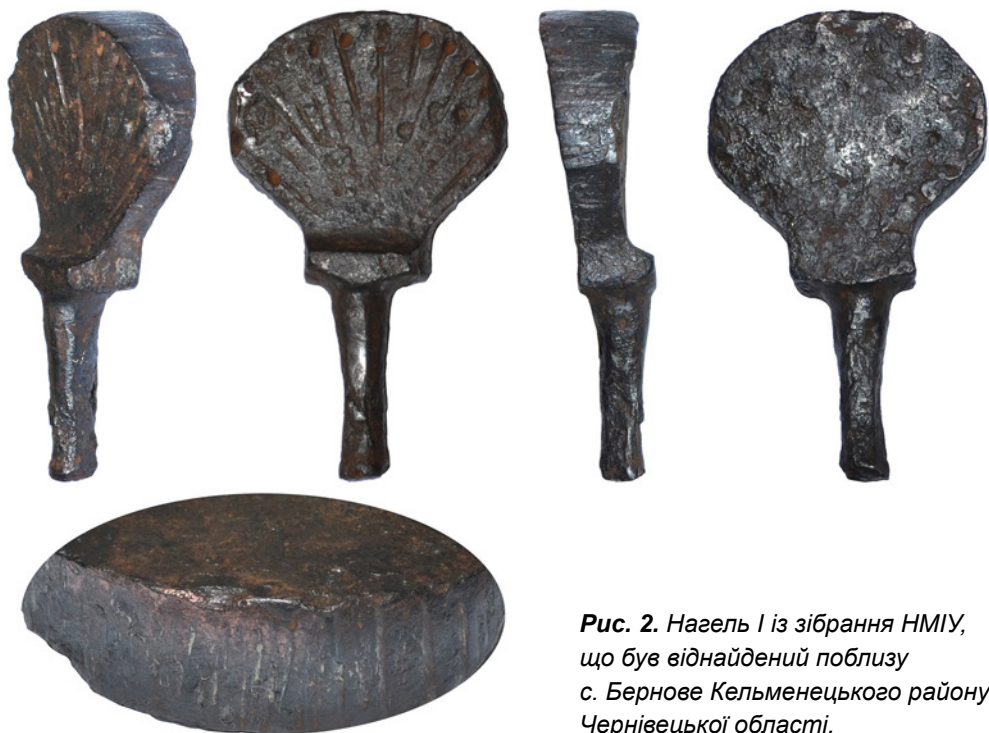
Рис. 2. Нагель I із зібрання НМІУ, що був віднайдений поблизу с. Бернове Кельменецького району Чернівецької області.