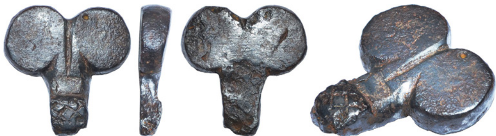
Рис. 7. Нагель VI із зібрання НМІУ, що був віднайдений в Крижопільському районі Вінницької області.