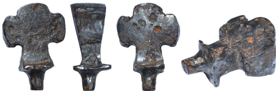
Рис. 9. Нагель VIII із зібрання НМІУ, що був віднайдений в Крижопільському районі Вінницької області.

Нагель IX із зібрання НМІУ (інвентарний номер № ТКВ-19593/5) (Рис. 10) був віднайдений поблизу с. Величківка Менського району Чернігівської об-