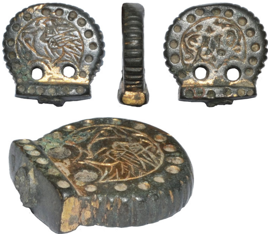
Рис. 4. Нагель III із приватного зібрання Є. Гредунова.

крашений орнаментом та позолотою, від якої залишилися лише окремі фрагменти. Периметр нагелю хвилястий, дещо стертий від використання у верхній частині. На плоских сторонах по периметру розташовані круглі поглиблення, що обрамляють малюнки у центрі. З одного боку можна розрізнити зображення пташки, а от малюнок з іншого боку не вдалося ідентифікувати. Біля основи два наскрізних круглих отвори. Стрижень відсутній. Загальна висота – 21 мм, висота круглого упору – 17 мм, найбільша ширина – 21 мм, а товщина – 4,5 мм, розмір прямокутної основи 16 на 6,5 мм з висотою 3 мм. Вага – 16 г.