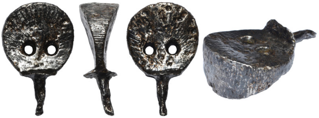
Рис. 5. Нагель IV із приватного зібрання Є. Гредунова.