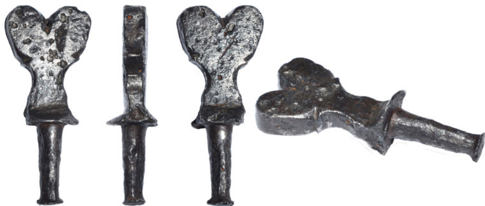
Рис. 8. Нагель VII із приватного зібрання Є. Гредунова.

його діаметер коливається від 7,5 до 5 мм. Загальна висота нагеля – 53 мм, найбільша ширина – 35 мм, діаметр отворів – 4 мм. Вага – 64 г.