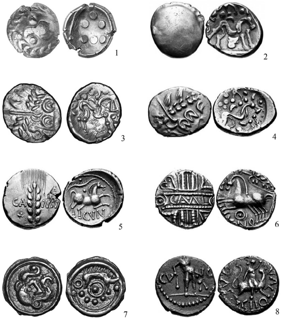
Рис. 3. Зразки кельтських монет.