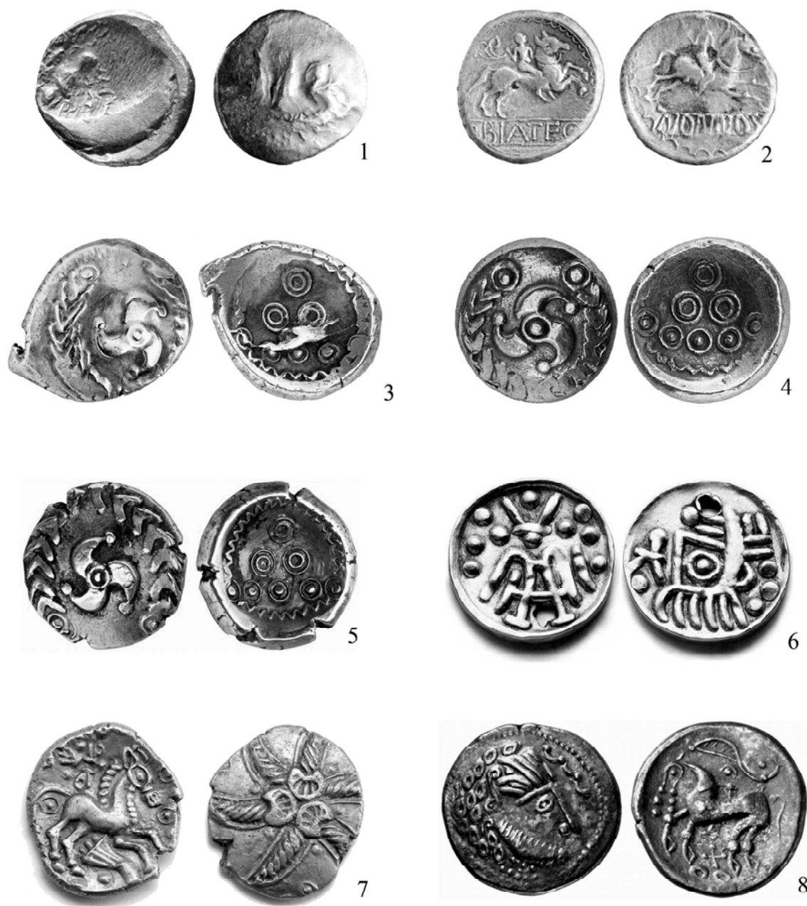
Рис. 2. Зразки кельтських монет.