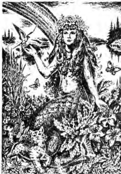
Рисунок Петра Качалаби "Русалка"

Чимало вже написано досліджень, в яких розглядається міфологічний світ "Лісової пісні". Усі дослідники творчості письменниці майже одноголосно зауважують, що в цьому легендарному творі найповніше зібрано пантеон низових Богів і духів, які завжди жили поряд з людьми. Найчастіше розглядалися ті образи, імена яких письменниця винесла на початок твору у "список діячів "Лісової пісні". До нього, крім людей, увійшло лише 13 імен: Лісовик, Водяник, Доля, Той, що в скалі сидить, Перелесник, Той, що греблі рве, Потерчата, Куць, Мавка (Лісова), Русалка (Водяна), Русалка Польова, злидні, Пропасниця.