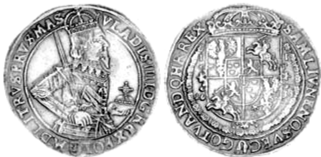
Талер, Владислав IV, 1633 р.

За Владислава IV Вази (1632–1648 рр.) емітувалися лише повновартісні номінали. Діяли два коронні монетні двори: бидгощський та краківський. На обох монетарнях періодично випускали півталери, талери та дукати. Бездіяльним залишався литовський монетний двір у Вільнюсі. Лише у 1639 р. тут виготовили великий золотий номінал – португал (10 дукатів). Зберігалися значні масштаби продукції міських монетарень: Гданська, Торуня, Ельблонга 11 .