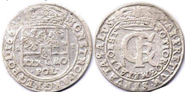
Тимф (злотівка), Ян II Казимир, 1664 р.

Монети повинні були мати масу 6,729 г і діаметр 31 мм, у тому числі 3,364 г чистого срібла, що з огляду на вартість срібла на ринку становило лише 40 % номінальної вартості. Реальна вартість злотівки не перевищувала 12 грошів. Це зазначалося в легенді монети: «DAT: PRETIUM: SERVATA: SALUS / POTIORQ3. METALLO. EST» – «БАЖАННЯ ВРЯТУВАТИ ДЕРЖАВУ ДОРОЖЧЕ, НІЖ ВАРТІСТЬ МЕТАЛУ». Їх емісія здійснювалась у Львові, Бидгощі та Кракові. Від прізвища автора проекту випуску білонних злотівок Андрія Тимфа ця монета отримала народну назву «тимф». Усього їх було відкарбовано близько 11 млн 250 тис. шт. 21 .