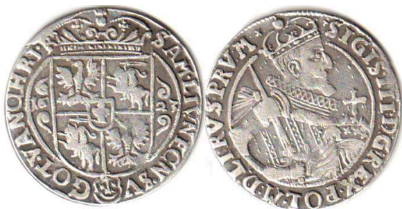
Орт, Сигізмунд III, 1623 р.

Коронні орти вперше було відкарбовано в 1618 р. З вагової гривни срібла виготовляли 31 монету цього номіналу, кожна з яких містила 5,222 г чистого металу. Масова емісія їх розпочалася лише в 1621 р. на бидгощському монетному дворі за новою монетною ординацією. Вміст чистого срібла в цьому номіналі знову зменшився до 4,955 г. Його вартість тоді становила 21 коронний гріш 8 .