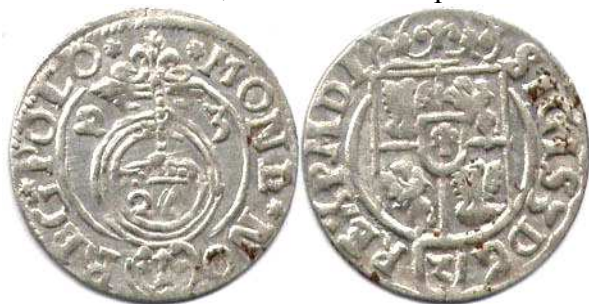
Півторак, Сигізмунд III, 1623 р.

Від 1614 р. розпочалася емісія ще одного нового номіналу – півторака ( \frac{3}{2} гроша). Зразком для нього стали німецькі апфельгрошени, або драйпелькери, про що свідчить вміщена на їх аверсі цифра \frac{1}{24} (в Німеччині з 24 таких монет складався один лічильний талер). З краківської гривни срібла карбували 128 півтораків. У кожному з них містилось 0,739 г чистого срібла 9 .