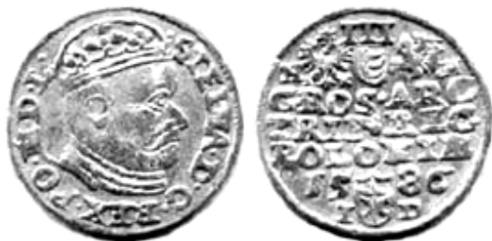
Трояк, Стефан Баторій, 1586 р.

відкрито познанський монетний двір. Тут емітували лише соліди та трояки, а також незначну кількість дукатів у 1586 р. 3