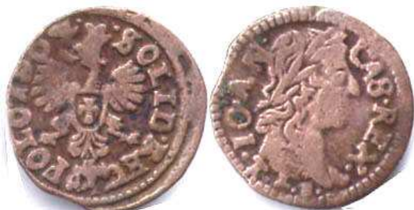
Боратинка коронна, Ян II Казимир, 1664 р.

2 червня 1661 р. Т.Л. Боратіні подав на розгляд сейму звіт про емісію мідної монети, який доводив, що рішення сейму 1659 р. було повністю виконане. Усупереч очікуванню, випуск 180 млн. мідних шелягів фінансового становища держави не поліпшив – він лише прискорив наростання інфляційних явищ. Тому в січні 1663 р. з Т. Л. Боратіні було укладено контракт про виготовлення мідних шелягів на суму 5 250 тис. Злотих на засадах монетної ординації 1659 р. У 1664–1665 рр. коронні шеляги карбувались у величезній кількості на уяздовському монетному дворі 19 .