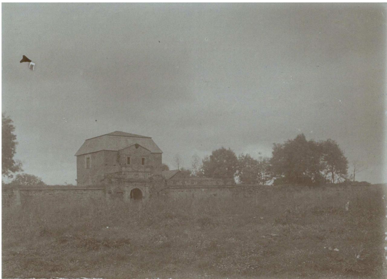
Фото 1. Замок у Чернелиці 1921 р. ЛННБ, Відділ рукописів, ф.26, спр. УК-47/16, арк. 146.

У матеріалах Відділу охорони пам'яток культури та мистецтва є також 18 фотографій, що відображають архітектурні споруди в Чернелиці – замок та римо-католицький костел Св. Антонія з Падуї, споруджений у XVII ст. Фотографії фортеці вміщені в справі УК-47/16. Мова йде про шість знімків (арк. 144–149), датованих 1921 роком 7 . Ще одне зображення замку знаходиться, очевидно помилково, в сусідній справі 8 . Усі фотографії замку виконано – 12 вересня 1921 р. 9 . Цим днем датуються також знімки костелу, хоча справа, в якій вони знаходяться, хронологічно відноситься до 1922 р. 10 . Одна з фотографій, яка відображає внутрішню частину святини, датується 22 вересня 1921 р. 11 . Швидше за все, усі фото чернелицьких пам'яток виконані однією людиною, прізвище якої не вдалося встановити. Не відомо, чи згадана особа спеціально прибула зі Львова до Чернелиці, чи Консерваторське Бюро скористалося послугами фотографів з Городенки або Коломиї. Можливо, знімки, виконані в 1921 р., були включені до матеріалів Відділу охорони пам'яток та мистецтва пізніше. З'ясування цього питання вимагає подальших досліджень.