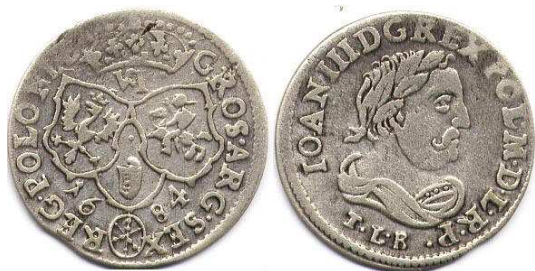
Шостак, Ян III Собеський, 1684 р.

У перші роки правління Августа II (1697–1733 рр.), який був одночасно герцогом Саксонії, монетно-грошові стосунки на землях польсько-литовської держави перебували у стані глибокої кризи. Більшість монетарень не функціонувала, грошовий ринок країни був наповнений неповновартісною вітчизняною та іноземною розмінною монетою. Ситуація ще більше погіршилась після вступу Речі Посполитої до антишведської коаліції і початку Північної війни (1700–1721 рр.). Через дестабілізацію політичного життя, окупацію країни військами Карла XII та ряд інших причин уряд не міг розпочати монетну емісію на власній території. Виробництво монет, згідно з польською монетною стопою, велося на саксонських монетних дворах 27 .