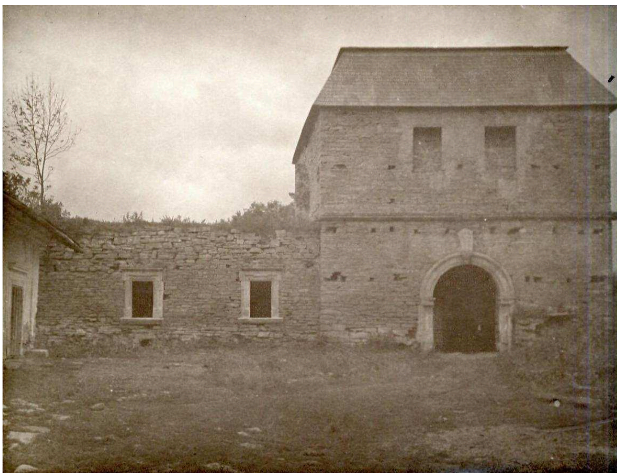
Фото 3. Надбрамна вежа зі сторони подвір'я замку. ЛННБ, Відділ рукописів, ф. 26, спр. УК-47/16, арк.148.

Аркуш 144 являє собою ідентичну копію зазначеної фотографії 16 . Ще одну копію цього знімка можна знайти в матеріалах сусідньої справи УК-47/17, яка містить також фотографії костелу в Чернелиці. Однак даний знімок має менший розмір – 13 x 9 см та виконаний на м'якому папері 17 .