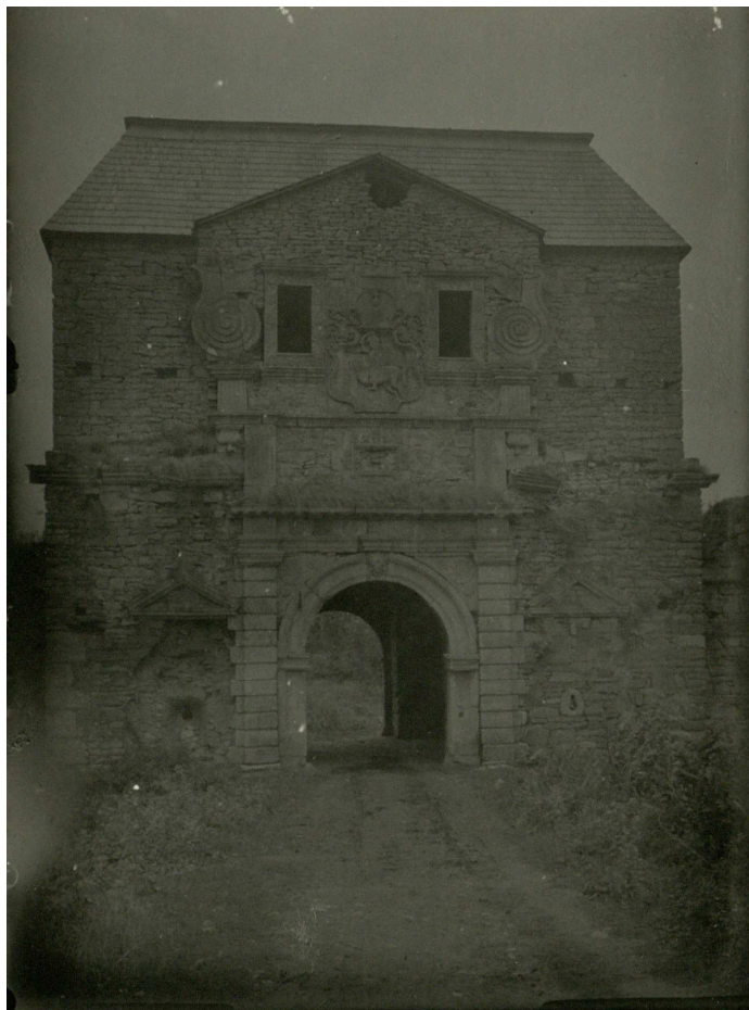
Фото 2. Надбрамна вежа із західної сторони. ЛННБ, Відділ рукописів, ф. 26, спр. УК-47/16, арк. 149.

Аркуші 145 та 146 являють собою копії згаданої фотографії. Перша з них є ідентичною, а друга відрізняється дещо більшим форматом (13 x 9,5 см) і темнішими кольорами 14 .