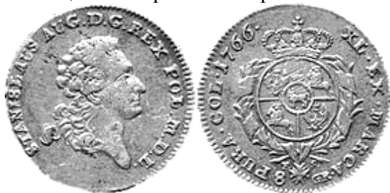
2 злоті (8 грош), Станіслав Август Понятовський, 1766 р.

За Станіслава Августа Понятовського (1764–1795 рр.) уряду вдалося впорядкувати грошове господарство країни. Карбована у великій кількості, згідно з реформою 1766 р., високоякісна польська монета швидко посіла панівне становище на ринку. З міді в Кракові (у 1765–1768 рр.) та Варшаві (у 1765–1795 рр.) випускалися шеляги, півгроші, гроші та трояки. Срібні номінали, які карбувалися у варшавській монетарні, представлені монетами вартістю 6 та 10 мідних грошів, 1 та 2 срібних гроші, 1 та 2 злотих, 1/2 талера та 1 талер.