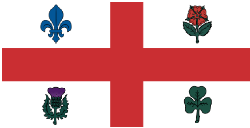
Прапор міста Монреаль (Квебек, Канада)