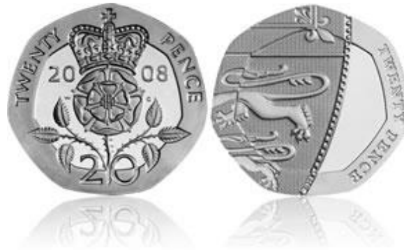
20-пенсові монети з 1982 – 2008 рр. з тюдорівською трояндою

This article is about the kings symboly in mediaval England. The author means, that the roses were as a symbols not only in the Roses war during 1455 – 1485, but also in the XXth in the Second World war.