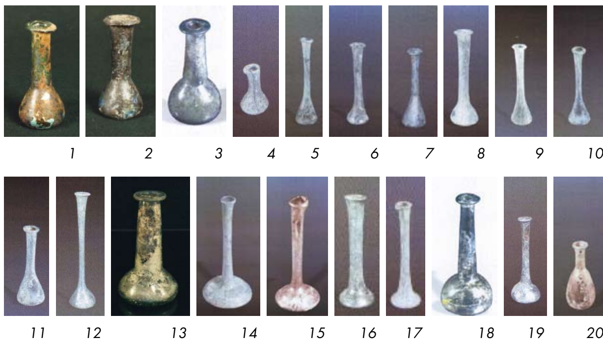
Рис. 7. Бальзамарїї

Найчисленнїшу групу виробів в колекції музею складають бальзамарїї (рис. 7). За формою тулуба серед них можна видїлити чотири типи: грушоподїбнї, конїчнї, розпластанї та напївсферичнї. Бальзамарїї першого типу (рис. 7, 1 – 4) мають цилїндричне горло (їнодї – з перехопленням в основї), вїдїгнутї горизонтальнї