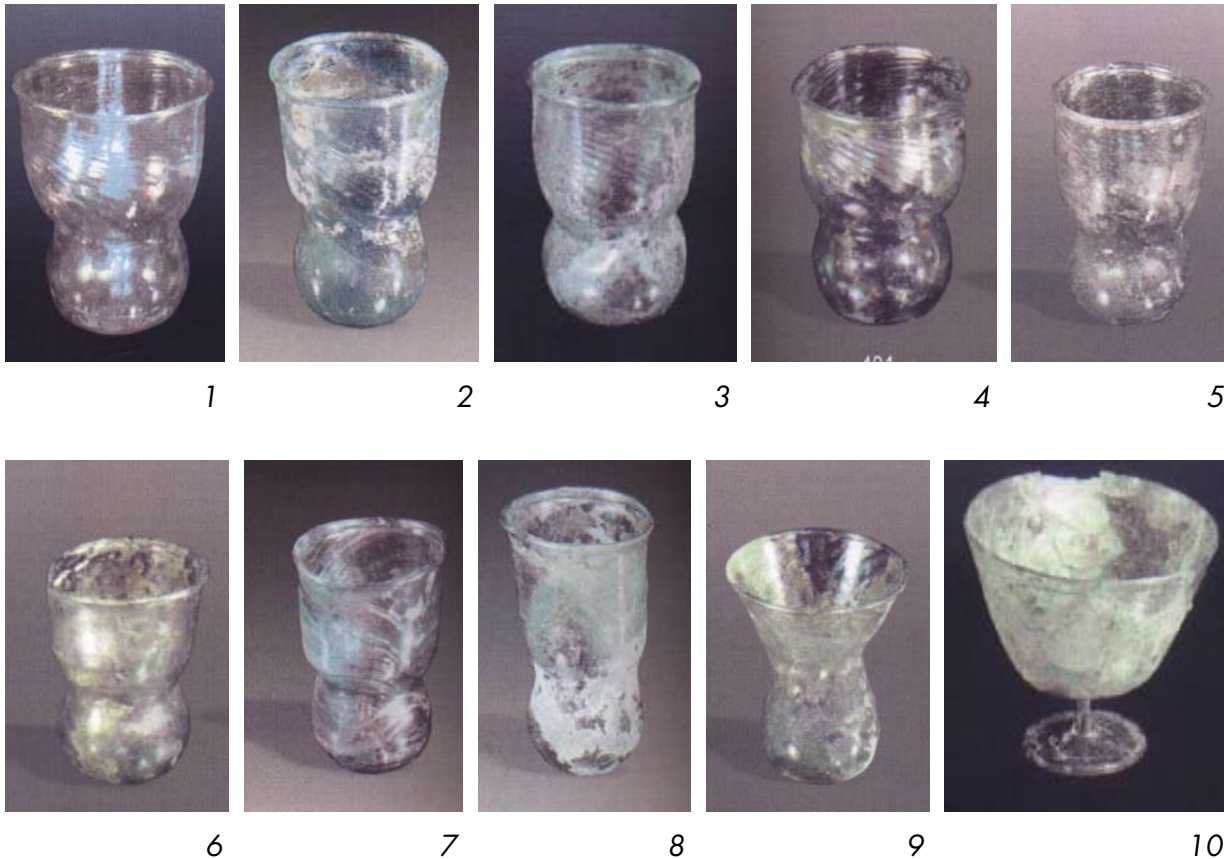
Рис. 5. Ранньосередньовічний скляний посуд

До колекції столового посуду входять 9 кубків (рис. 5, 1 – 9), що відносяться до готської культури та надійшли з околиць міста Севастополя (могильники Бакла та Альминський). Виготовлені в техніці вільного видування у форму, всі вони мають циліндричну форму вище перетяжки та кулясту – нижче. Виключенням є кубок (рис. 5, 9), воронкоподібний у верхній частині тулуба. Дно увігнуте, вінця відігнуті та утворюють порожнистий валик. Верхня частина тулуба покрита діагональною спіраллю, яка одержана за допомогою видування у жолобчасту форму з подальшим прокручуванням.