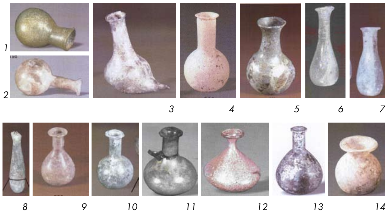
Рис. 6. Флакони

тулубом та коротким циліндричним горлом, що закінчується широко відігнутими назвнї вінцями. Дно маленьке, пласке, зі слїдами понтїї. За якїстю скла арибал надзвичайно схожий з флаконом (рис. 6, 4), що дозволяє датувати його за аналогією з останнім.