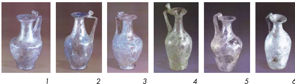
Рис. 1. Глечики 1 типу

Перший тип представлений шістьма глечиками** (рис. 1), виготовленими в техніці вільного видування, які мають широкий тулуб, що звужується донизу, та вигнуту ребристу стрічкоподібну ручку з петельчастим виступом над вінцями. Горло глечиків розширюється донизу, на увігнутому дні зберігся слабкий слід понтії. Три глечики (рис. 1, 1 — 3) мають кільцеву підставку.