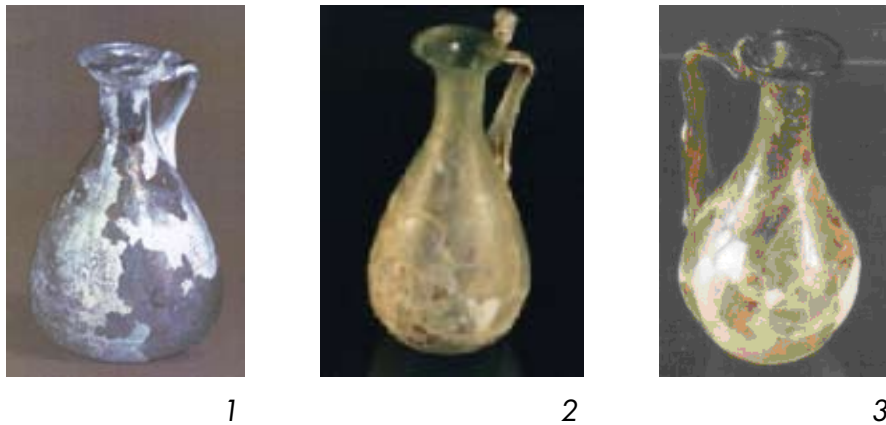
Рис. 2. Глечики 2 типу

До другого типу відносяться два глечики (рис. 2, 1 – 2) з невисоким горлом, профільованими вінцями та стрічкоподібною ручкою. Перший глечик, прикрашений сімома гравійованими пасками, має плоске дно, а другий – слабо увігнуте, зі слідами понтії. Його пласка ручка з одним слабо вираженим ребром закінчується петлею вище вінця. Подібної форми є також більш пізній за часом глечик (рис. 2, 3). Слід зазначити, що тут явно простежуються античні традиції, хоча скло більш низької якості, з характерним для цього періоду оливковим відтінком.