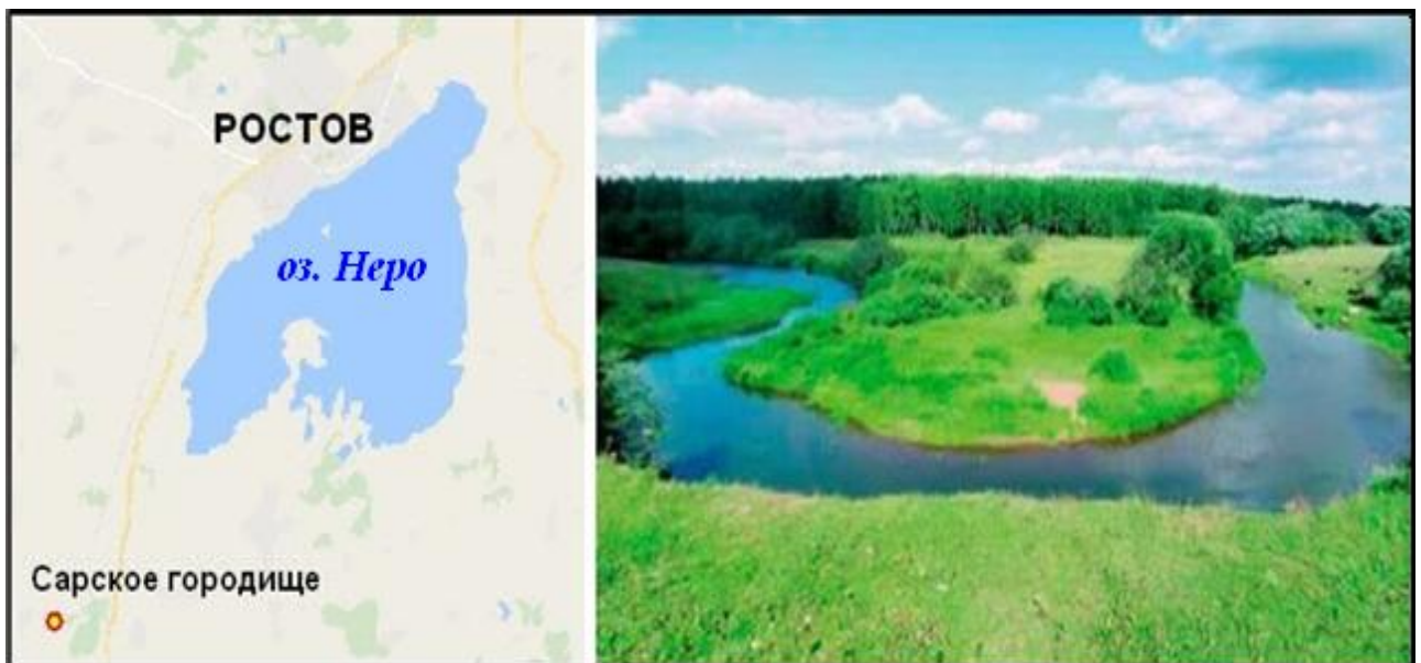
Озеро Неро і Сарське городище.

Але справжнім адміністративним центром Волго-Клязьминського межиріччя як ядра майбутнього Ростово-Суздальського межиріччя був Ростов, розташований на березі озера Неро, неподалік якого лежить Сарське городище, середня частина якого, обнесена валами, займала площу 8000 кв. км [Седов В.В. 2002, 390].