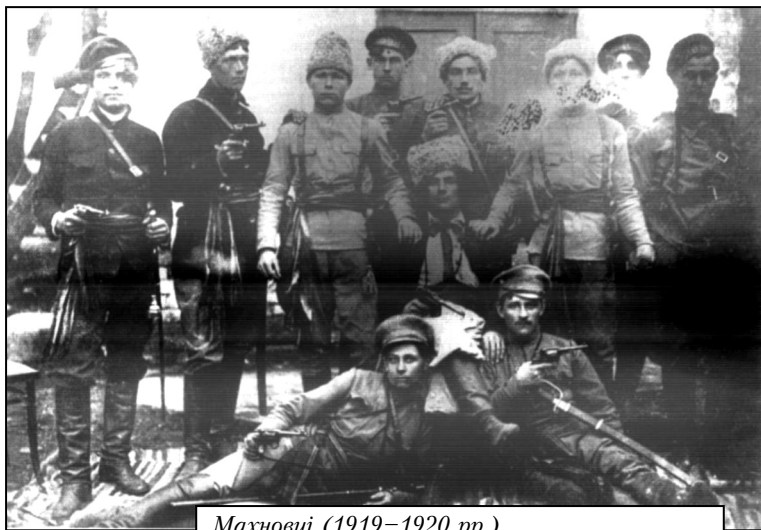
Махновці (1919–1920 рр.)

Для проведення мобілізації, насамперед її