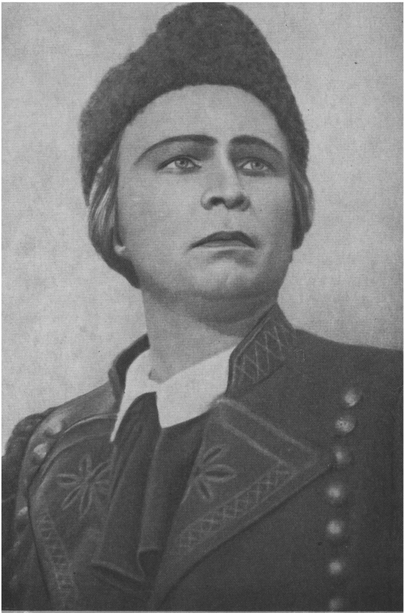
Єнек. «Продана наречена» Сметани.