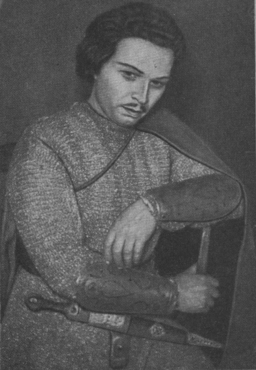
Князь Синодал. «Демон» Рубінштейна.