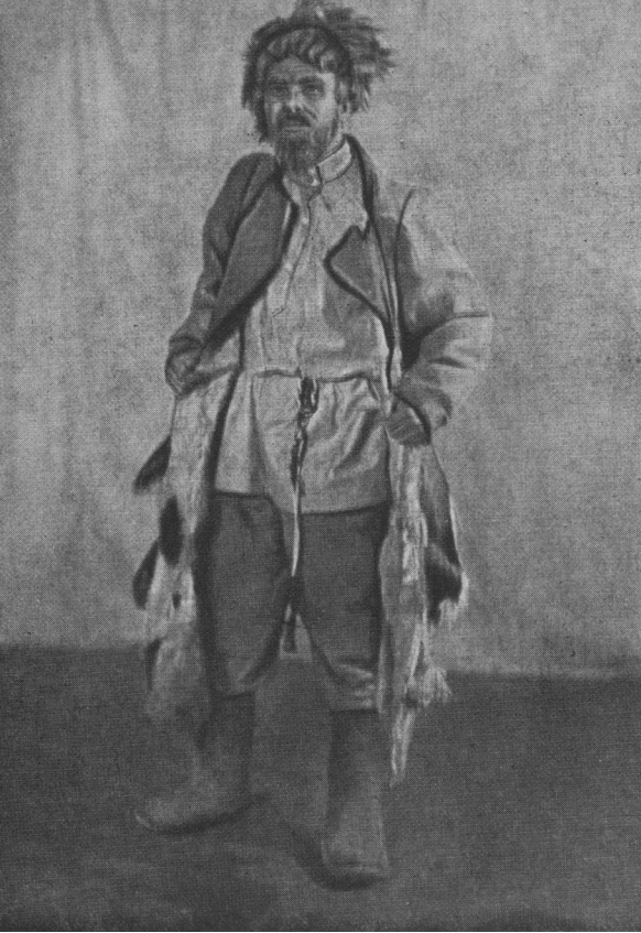
Дід Жукар. «Піднята цілина» Дзержинського.

стільки людського болю і суму, стільки трагізму, що образ цей набув значного художнього узагальнення.