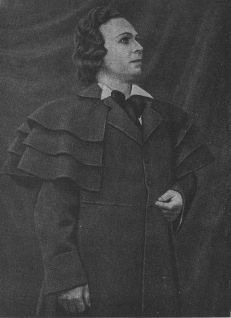
Ленський. «Євгеній Онегін» Чайковського.

П. Чайковського), князя («Русалка» О. Даргомижського), Фауста (однойменна опера Ш. Гуно), Пінкертон («Чіо-Чіо-Сан» Пуччіні).