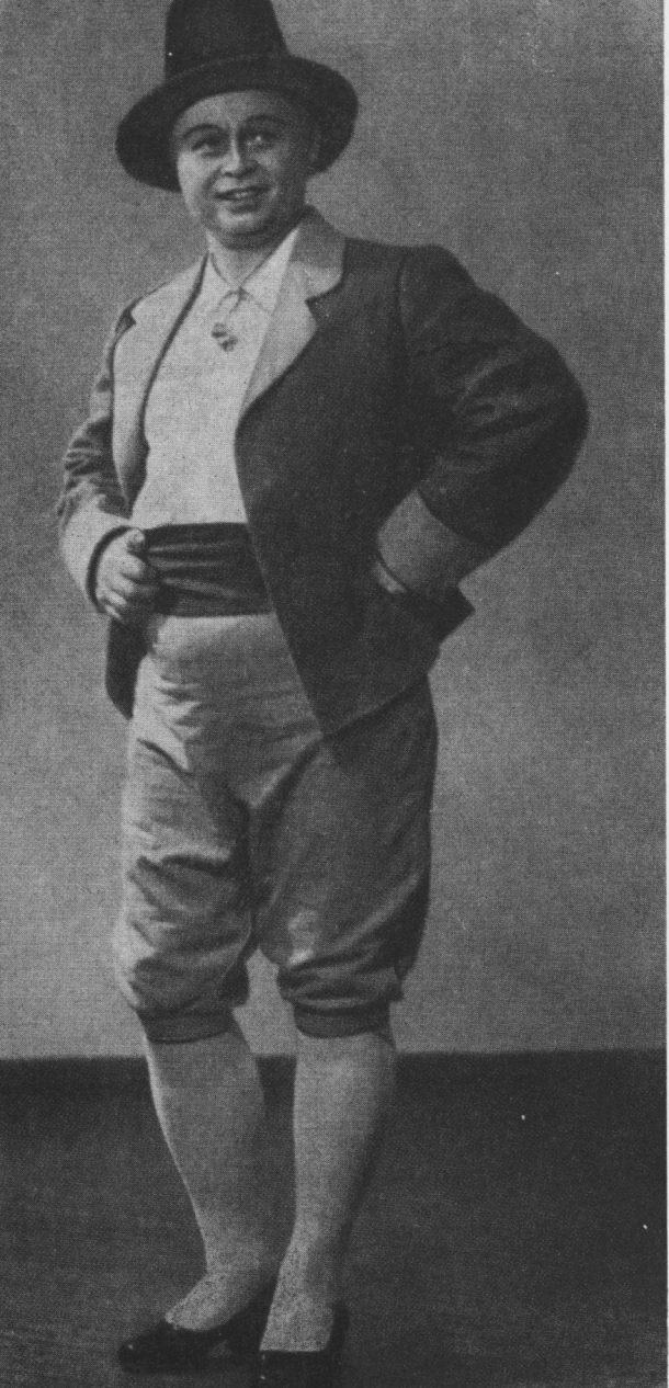
Арлекін. «Пяци» Леонковалло.