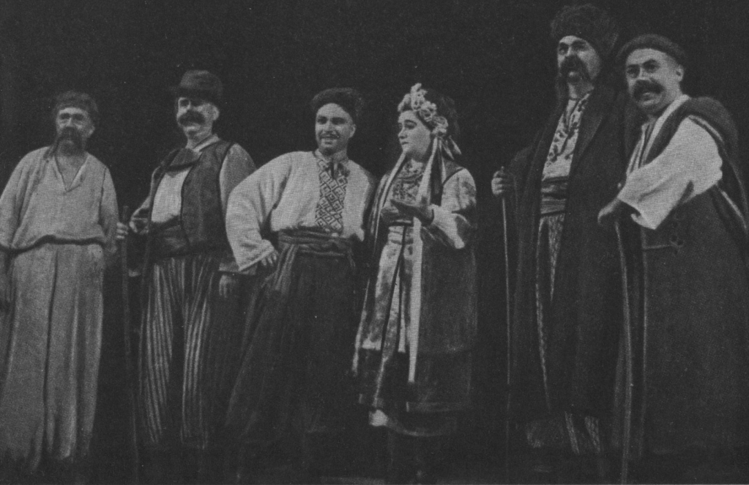
Сцена з вистави «Утоплена» Лисенка.