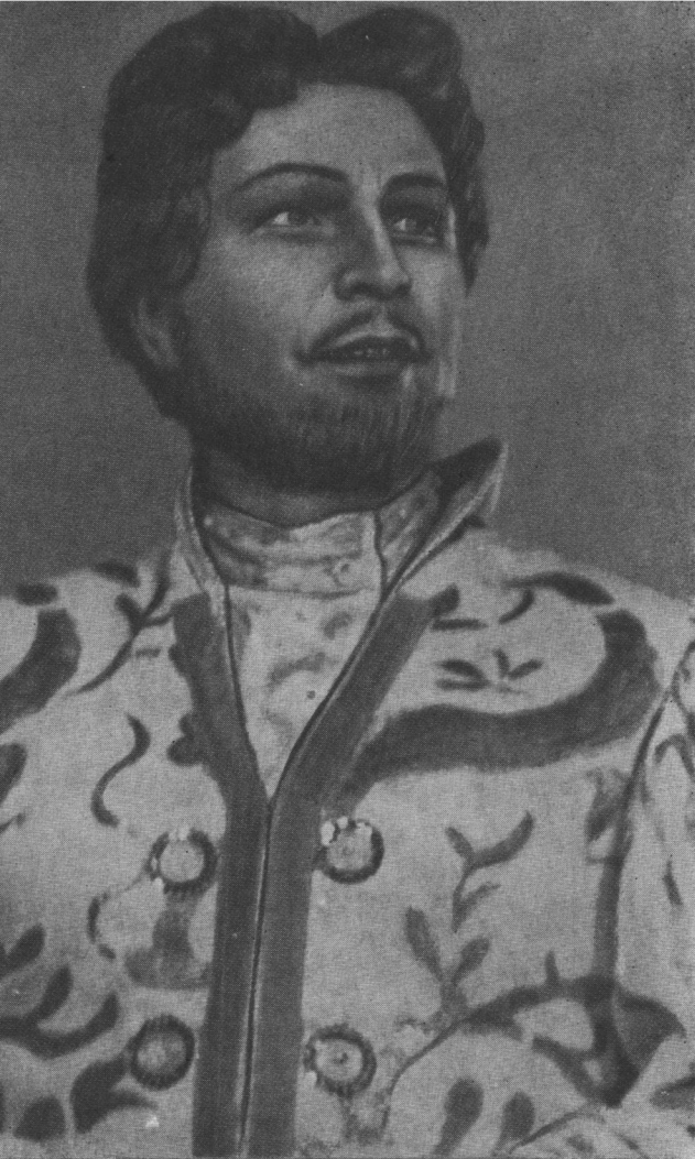
Ликов. «Царева наречена» Римського-Корсакова.