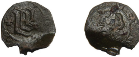
Мал. 1.2. Геллер Анни Рацібузької (1380–1405)