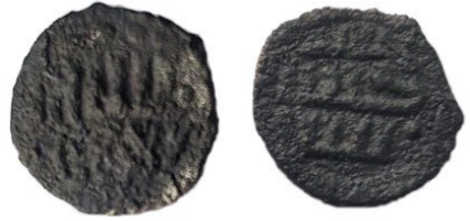
Мал. 1.1.а. Наслідування дангу Джанібєка, Гюлістан 753 р. Х. (фото)