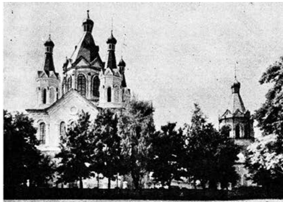
Мал. 2. Фото Георгіївської церкви з книги «Памятники градостроительства Украинской ССР»