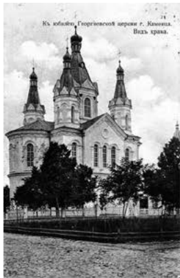
Мал. 1. Вид Георгіївської церкви 1911 року.