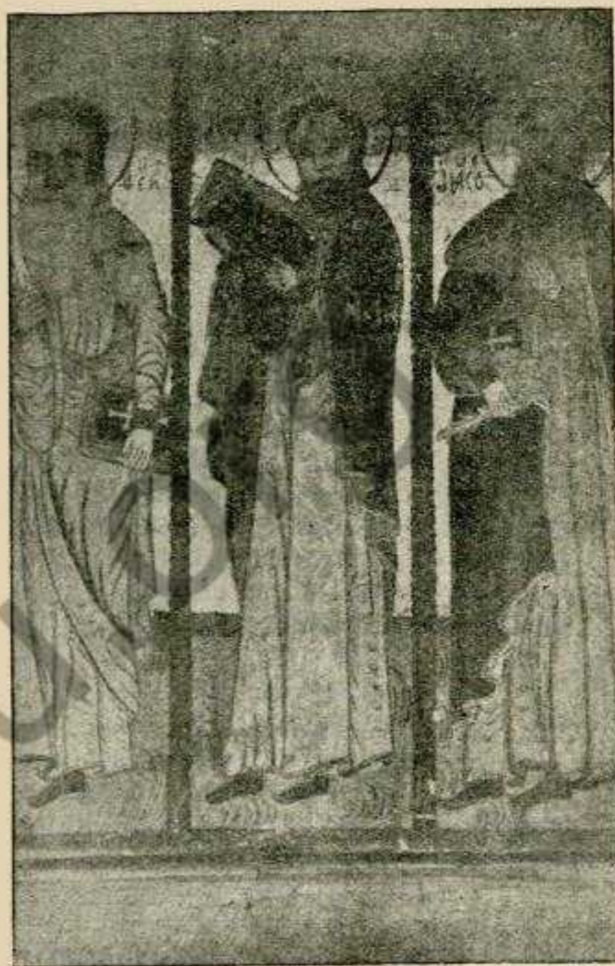
Фіг. 3. Ікона з Євангелистами з Обляшки, половина XVII ст.

менш інтензивне, маляр старався надати обличчю характер пластичности. Але се пластичне модельовання йому не вдається. Він не вміє тільки вартостю краски і модельовання надати округлости обличчю Мадонни. Тому він допомагає собі лініями. Як се модельовання лініями випадає, про се свідчить шия