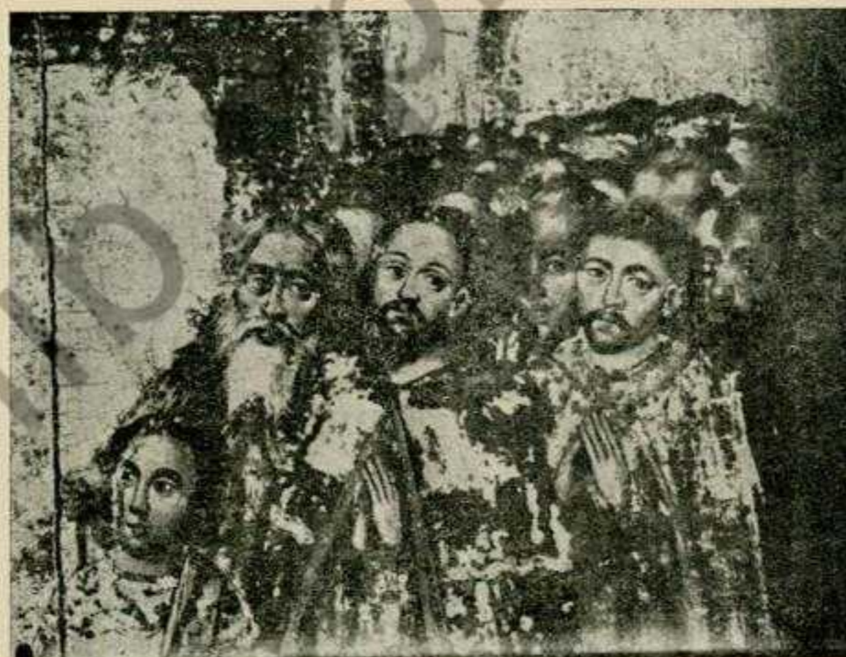
Права група образу.

Біля боярина — гетьман Самойлович. До портретів належать і дві головки молодих людей,