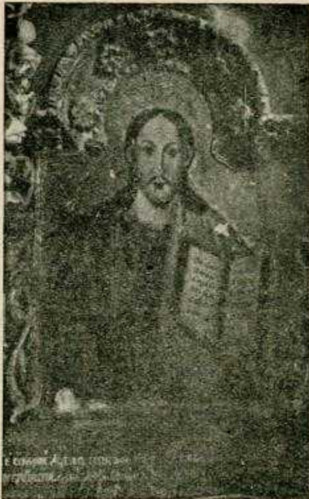
Фіг. 5. Христос Вседержитель. Намісна ікона з Бистрого коло Сваліяви, XVII ст.

лося також зображення обличчя Богородиці. В Калинах се був надіндивідуальний строгий тип, недоступний для виразу яких небудь людських почувань. В Бистрім сей тип замінений вправді також ідеальним зображенням о згармонізованих клясичних пропорціях, але