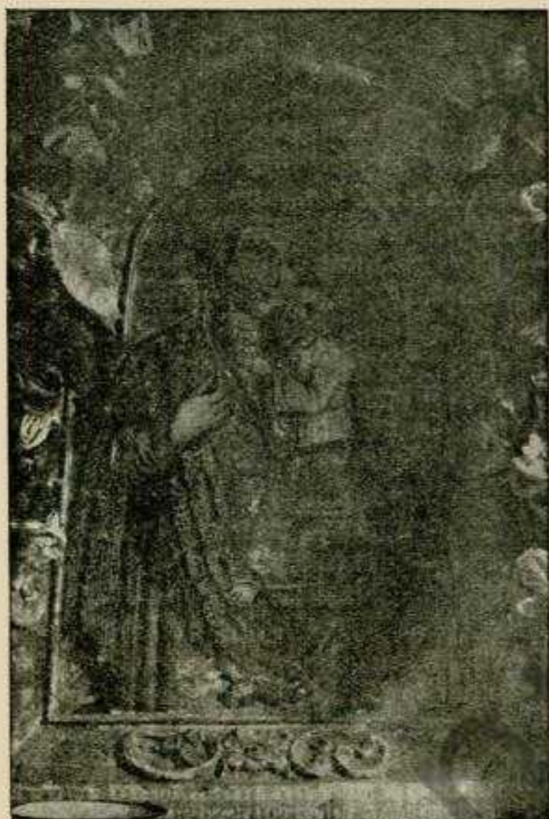
Фіг. 4. Богородиця з іконостаса в Бистрім коло Сваліяви. XVII ст.

Пригляньмося Євангелистам і Апостолам в Обляшці (фіг. 3.). Подибуємо тут той сам лінеарний стиль, що в Калинах. Він тут може не так строго додержаний, але в кождім разі про модельовання фігур не може бути бесіди. 1) Одяг Євангелиста Матея модельований рівнож при помочи ліній. Тільки що ці лінії стратили сю геометричну стилізованість пр. Мадонни в Калинах. Одяги м'якші і маляр відчуває потребу віддавання богатих фалдів. Приміром рубці фалдів, які віддані у звоях,