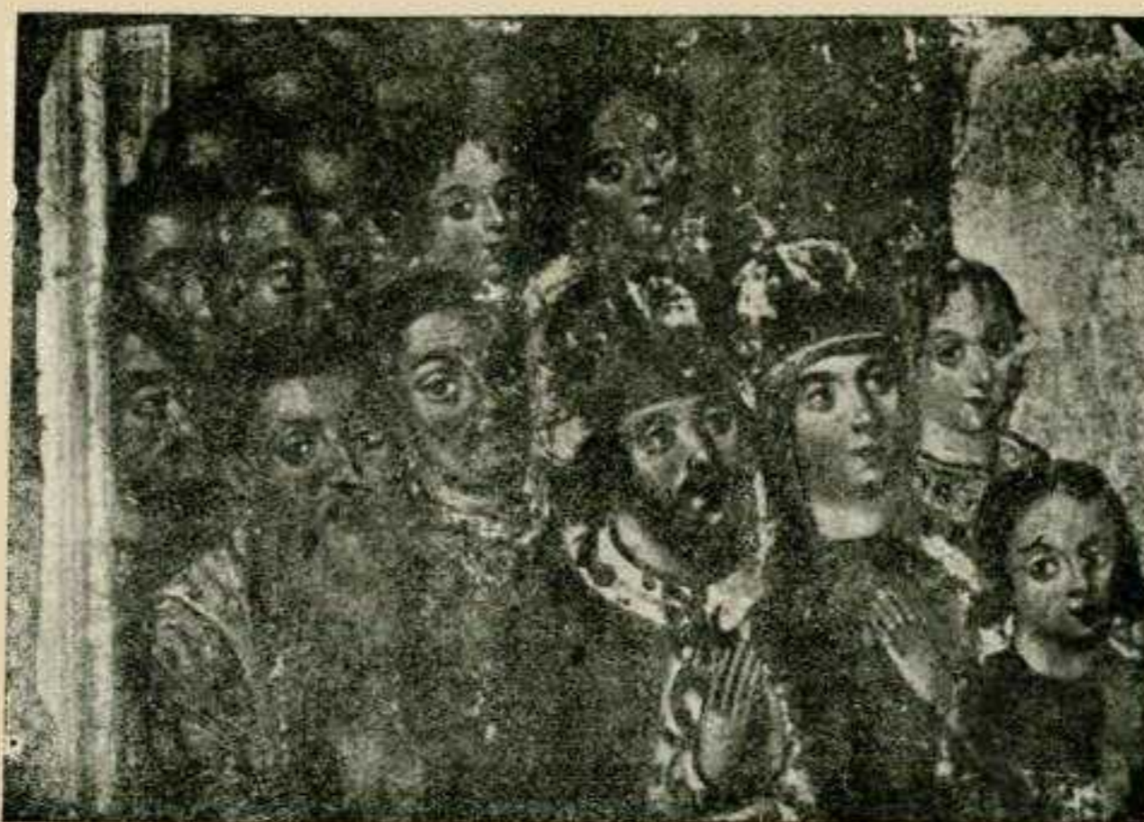
Ліва група образу.

зауважити, що колиб наш артист хотів намалювати Софію і бував навіть у Москві, навряд би він царівну побачив: вона, як жінка, по тодішніх