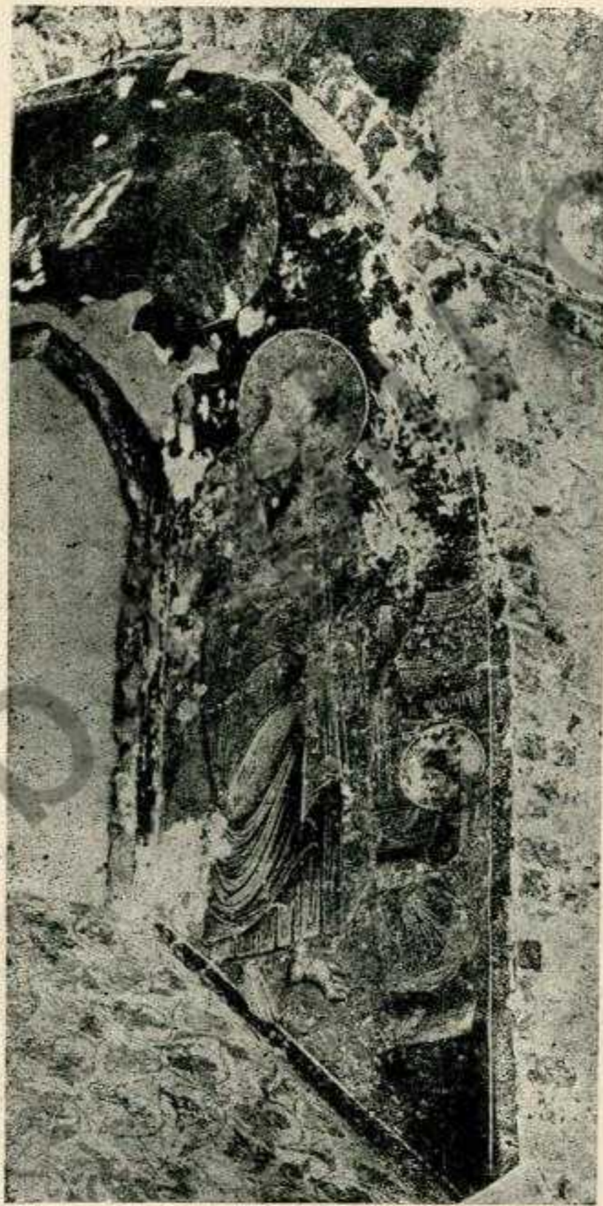
ФРЕСКИ ВІРМЕНСЬКОГО СОБОРУ У ЛЬВОВІ.

Правий бік віконної ніші, покритий фресками: зображення Христа Пантократора, св. Івана Богослова і св. Прохора та фрагмент килимового орнаменту.