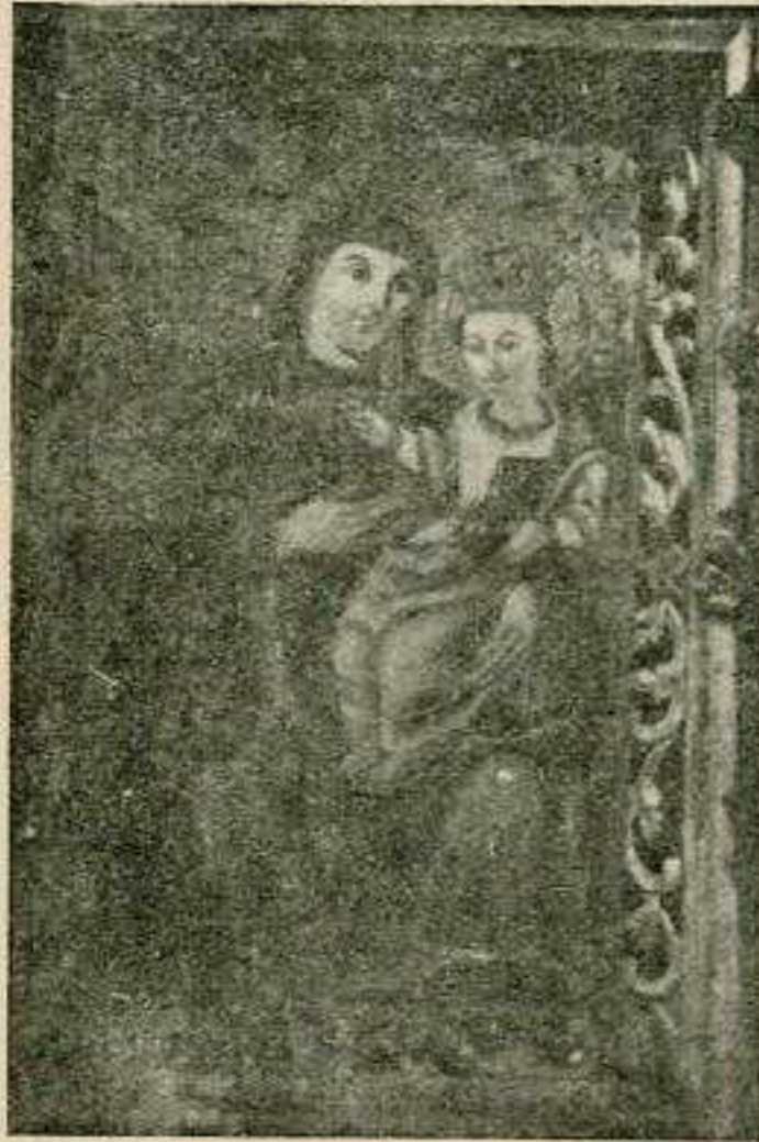
Фіг. 6. Богородиця.

бароковим стилем. 1) Сей процес є властивим змістом розвою малярства на Закарпатській Україні в другій половині XVIII стол. А тим самим маємо один доказ більше, що мистецько-історична фізіономія Закарпатської України не ріжниться на загал від мистецько-історичної фізіономії прочих наших земель. Одиною ріжницею є часове пере-