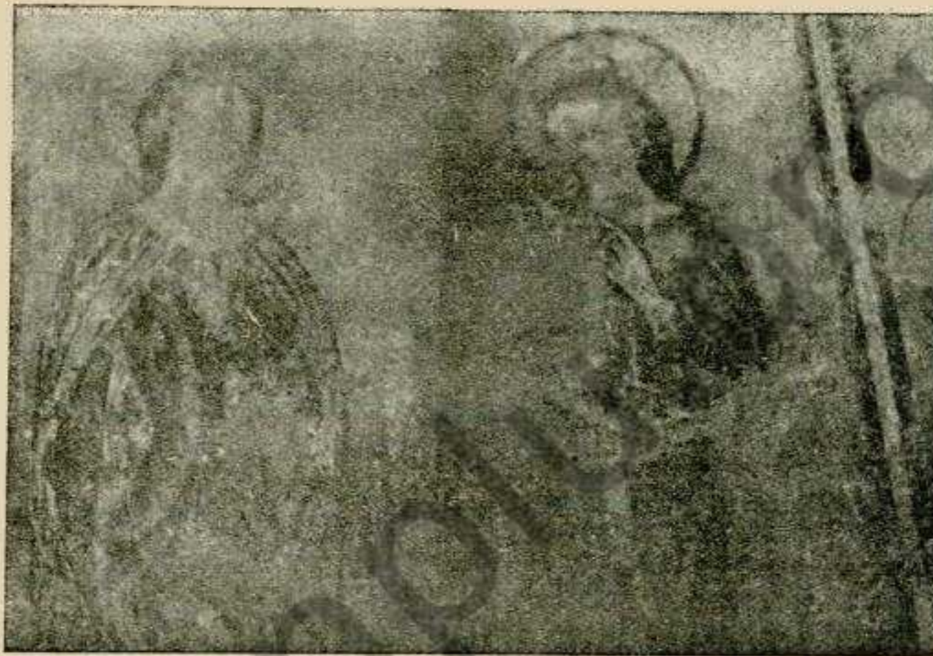
Фіг. 1. Фреска в замковій каплиці в Горянах: св. Катерина і жіноча свята. 2 пол. XIV стол.

Дещо відмінний стиль готицький без тих сильних італійських впливів мають фрески