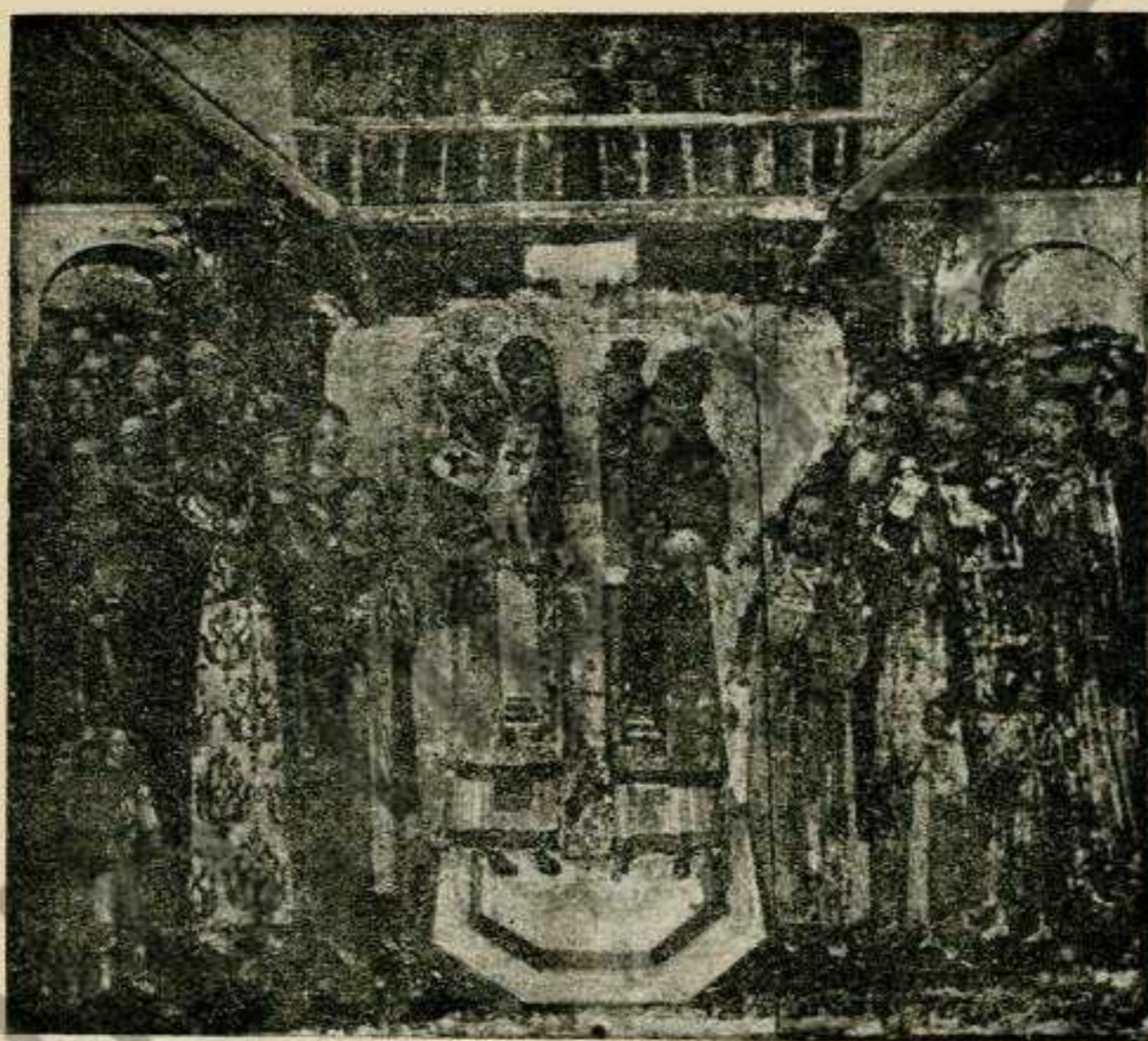
Образ Воздвиження Хреста з церкви с. Ситихова біля Львова.

Площа симетрії композиції проходить через лінію симетрії хреста. Лінії, які відносно площі ікони йдуть в глибину, не мають спільної точки сходження. Наприклад: бокові краї підвішення, на котрому стоять архиереї, сходяться вище верхнього краю образу, а рівнобіжні до них лінії, бокові краї прибудовань над входами, власне дашків