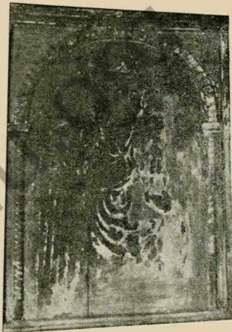
Фіг. 2. Одигитрія, ікона з церкви в Калинах (находиться в притворі). Кінець XVI ст.

Візантійсько-український стиль був поширений в XVII стол. Старших памяток льокального малярства, як з кінця XVI і початку XVII ст., мені не трафлялося подибати, хоч тим не сказано, що сей стиль не був тут давнійше поширений. Ограничуся до двох зразків