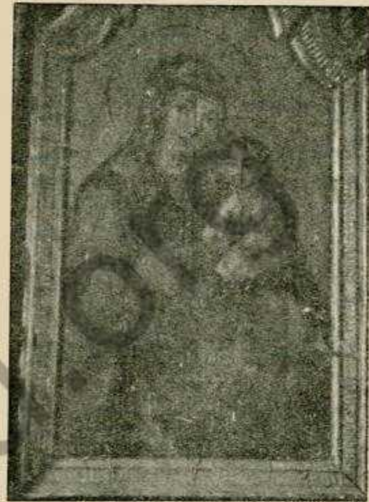
Фіг. 7. Богородиця.

З загальної точки погляду малярство Закарпатської України є явищем перифе-